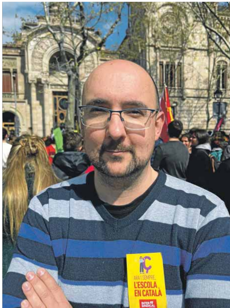
Furest , fotografiat en la manifestació de dimecres passat contra la sentència del 25%

N’hi ha. A Intersindical Educació hem obert una bústia de