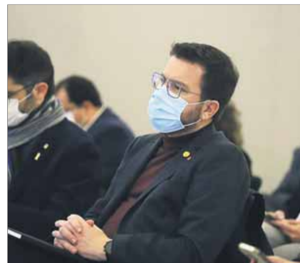
El president, Pere Aragonès, ahir, a Pedralbes