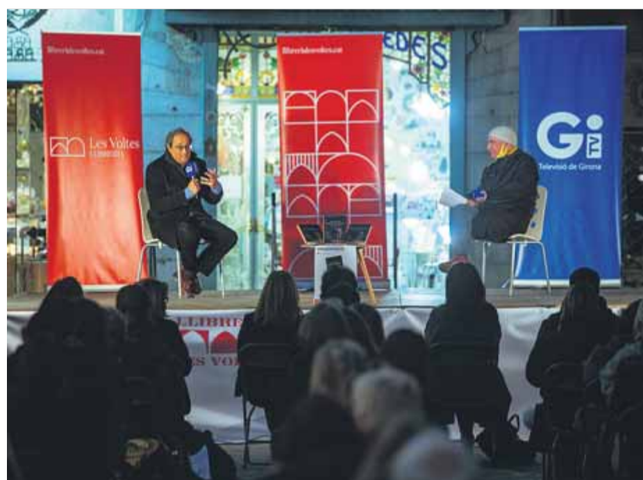
Presentació del llibre 'Les hores greus', de Quim Torra, fa un any, a Girona

LES HORES INCERTES. DIETARI DE CANONGES Autor: Quim Torra i Pla Editorial: Símbol Editors Pàgines: 295