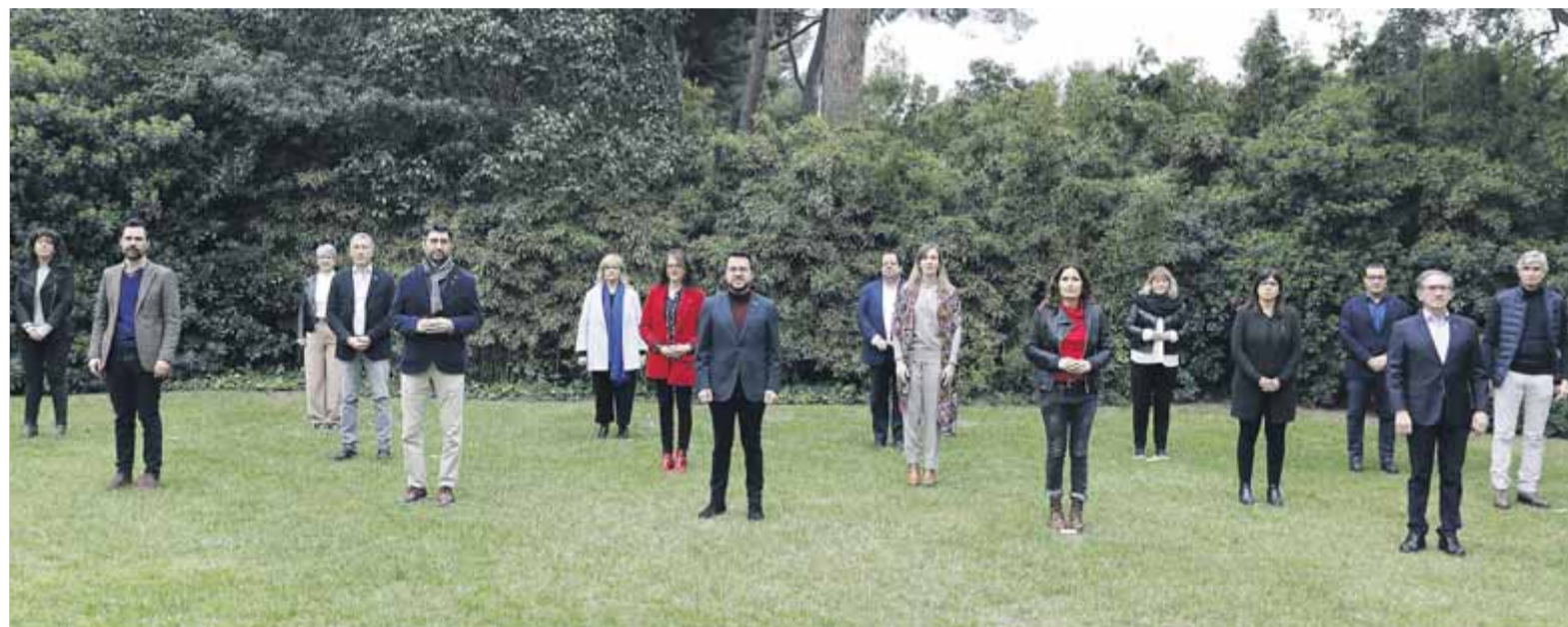
Foto de grup del govern, ahir, als jardins del Palau de Pedralbes

■ L'executiu aposta per ampliar el consens al voltant del pacte que inclou el castellà com a llengua d'ús a l'escola ■ Junqueras contraposa la cohesió d'Esquerra davant de "projectes que prioritzen les seves disputes internes"