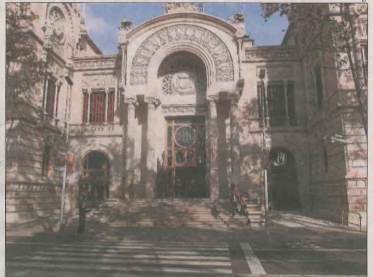
Exterior de l'Audiència Provincial de Barcelona.

Segons la sentència, ha quedat acreditat que el lleidatà, que ara viu a Sitges, s'hauria dirigit a diverses entitats bancàries en les quals "actuant en nom propi o de societats creades per ell", sol·licitava l'obertura de comptes corrents i entrega de terminals de punt de venda (TPV), "que vinculava als comptes que obria", i va dur a terme una quantitat d'operacions "fraudulentes" de manera que les quantitats que s'ingressaven en els comptes que anava obrint eren reexpedides, transferides, a altres comptes, "dificultant amb això el seguiment dels diners". L'Audiència assenyala que l'acusat va efectuar operaci-