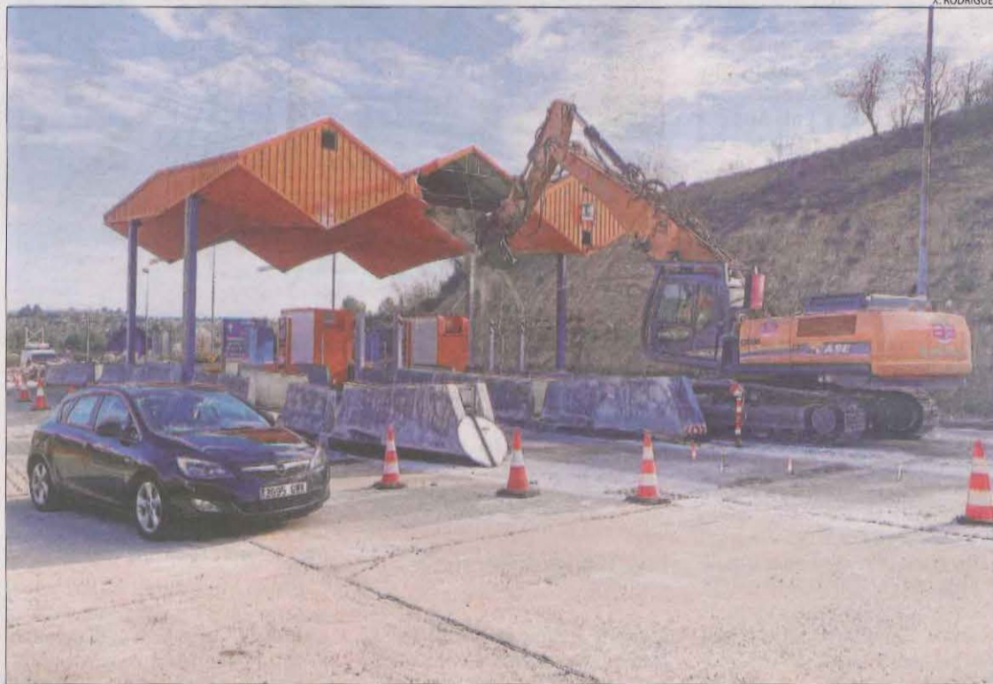
Els treballs de demolició de les casetes de peatge de l'Albi, que van començar ahir.