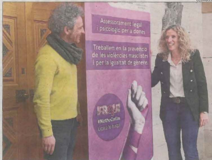
Presentació ahir del programa d'actes a l'Urgell.

El 8 de març, la capital del Segrià tornarà a comptar amb dos manifestacions. Una, convocada per Marea Lila que sortirà a les 18.00 hores des de la plaça Ricard Viñes fins a Sant Joan, i l'altra, organitzada per la Coordinadora 8-M, que sortirà a les 19.00 hores des del Rectorat de la UdL. A l'Urgell, el Servei d'Informació i Atenció a les Dones del consell comarcal ha editat una