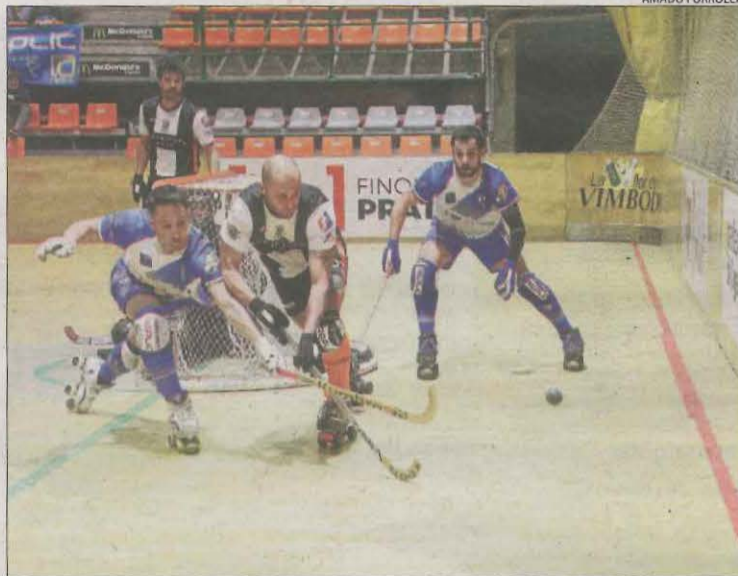
Una acció de l'últim partit de Lliga del Lleida, davant del Palafrugell.