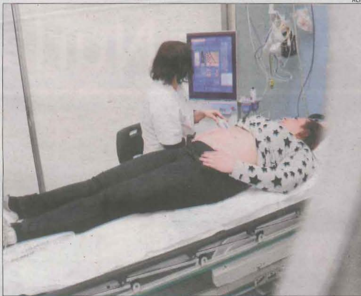
Imatge d'arxiu d'una metgessa fent una ecografia.

D'altra banda, un informe elaborat pels tècnics del ministeri d'Hisenda (Gestha) amb dades de l'Agència Estatal d'Administració Tributària va tornar a posar ahir de manifest la bretxa salarial a les comarques lleidatanes. Per sectors, va destacar que les professionals de la indústria extractiva, el comerç, el transport, l'oci o les reparacions són les que pateixen més desigualtats, cobrant fins un 44% menys que els seus companys homes.