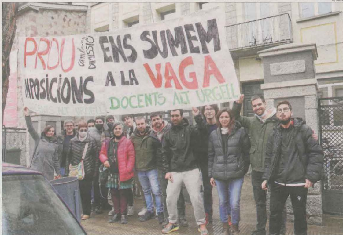
Docents de l'institut Joan Brudieu de la Seu davant d'una pancarta de suport a la vaga.

Els sindicats es van mostrar ahir confiats que, especialment avui, l'aturada serà la més important dels últims 30 anys. Van donar per fet que serà majoritària als instituts, mentre que a Primària i, sobretot, a la concertada, la mobilització serà menor. Tres autocars de docents parteixen aquest matí des de Lleida cap a la manifestació prevista a Barcelona, i hi haurà actes reivindicatius a Tremp, la Seu d'Urgell, Vielha i a l'institut Guindàvols de Lleida. L'Assemblea de Docents de l'Alt Urgell va anunciar ahir que s'adhereix a l'aturada per "la gravetat" de la situació i per "millorar la qua-