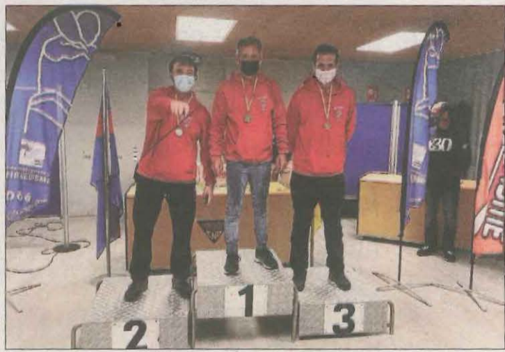
Els palistes de Sícors van copar el podi a Masters B.