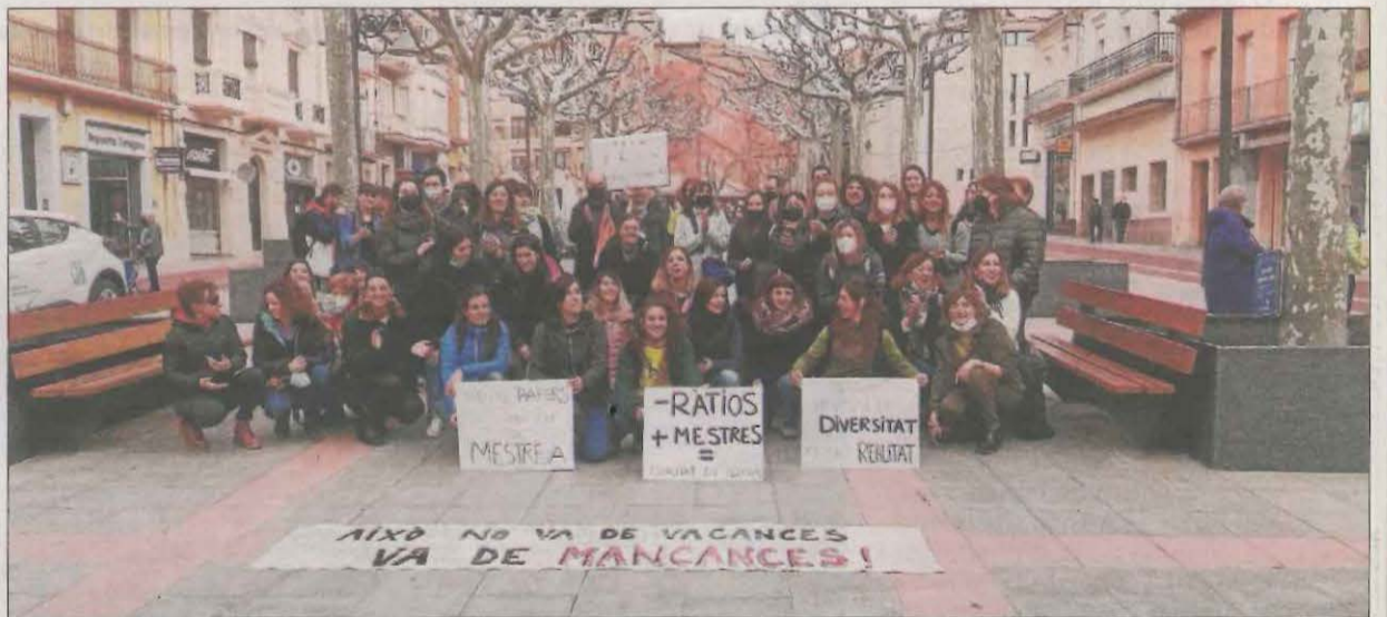
Concentració de professors a Tremp reclamant millores en educació.