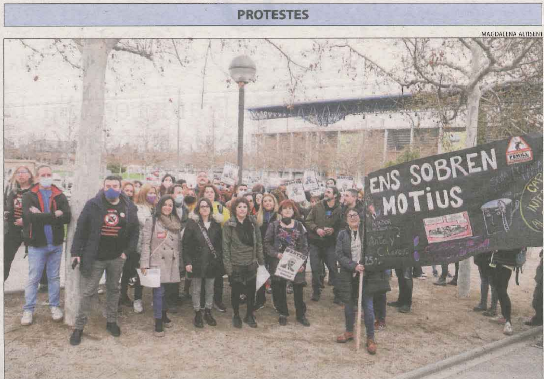
Docents de Lleida ahir al Camp d'Esports abans de sortir cap a la manifestació a Barcelona.