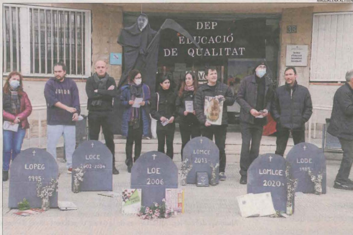
Professors de l'institut Guindàvols van escenificar un cementiri de lleis educatives davant del centre.

L'acte central de la jornada va ser una manifestació de docents a Barcelona en què van participar 22.000 persones, segons la Policia Local, i entre 40.000 i 60.000, segons els sindicats. La marxa va discórrer entre els Jardins de Gràcia i la seu d'Educació a Via Augusta, presidida per una pancarta amb el lema "Prou imposicions! Prou