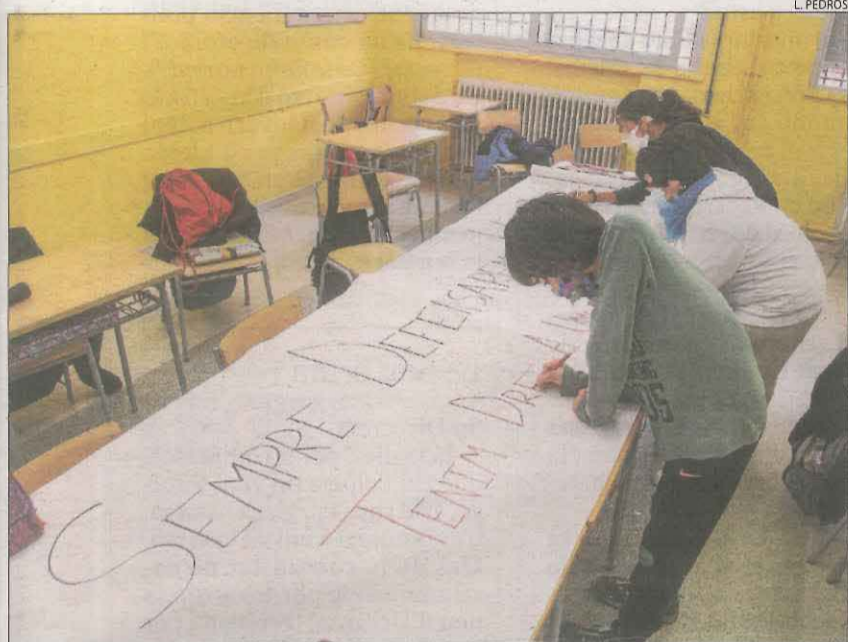
La vaga va ser majoritària a l'institut Manuel de Pedrolo de Tàrrrega.

a Tremp, Vielha i a l'institut Guindàvols de Lleida. D'altra banda, uns 4.000 docents es van manifestar pel centre de Girona. Els assistents van carregar contra el departament d'Educació al no tenir-los "en compte" i van demanar la dimissió del conseller Josep González-Cambray, a qui van fer responsable del "manteniment de les retallades".