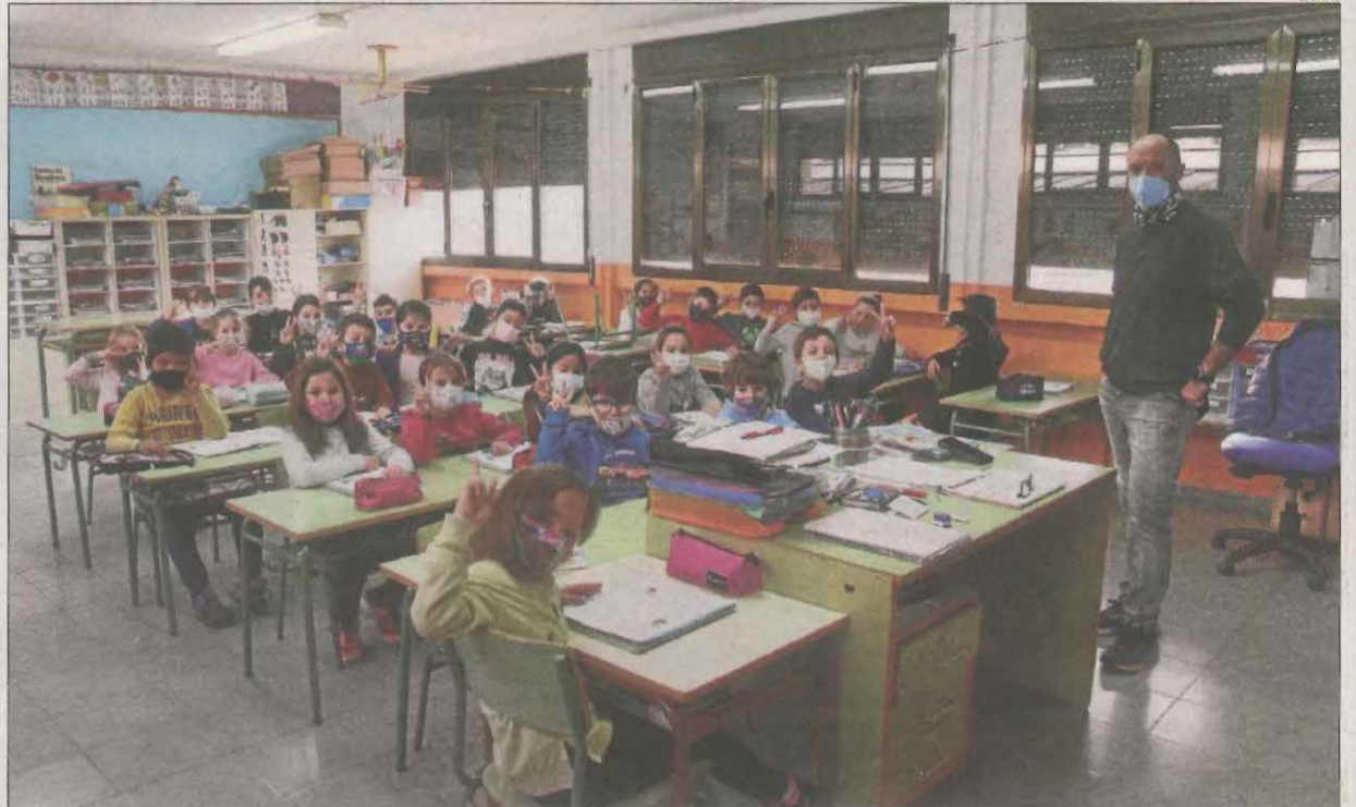
Alumnes del col·legi Albert Vives de la Seu d'Urgell fent classe de forma normal.