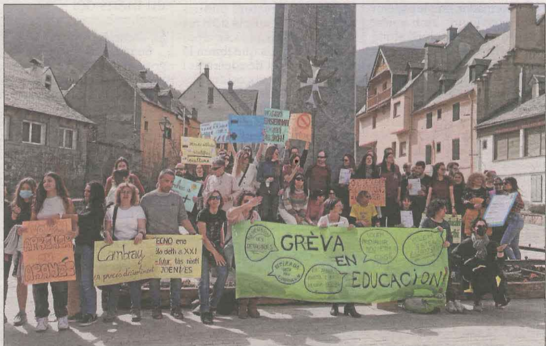
Professors de Vielha es van concentrar ahir davant de la seu del Conselh Generau.