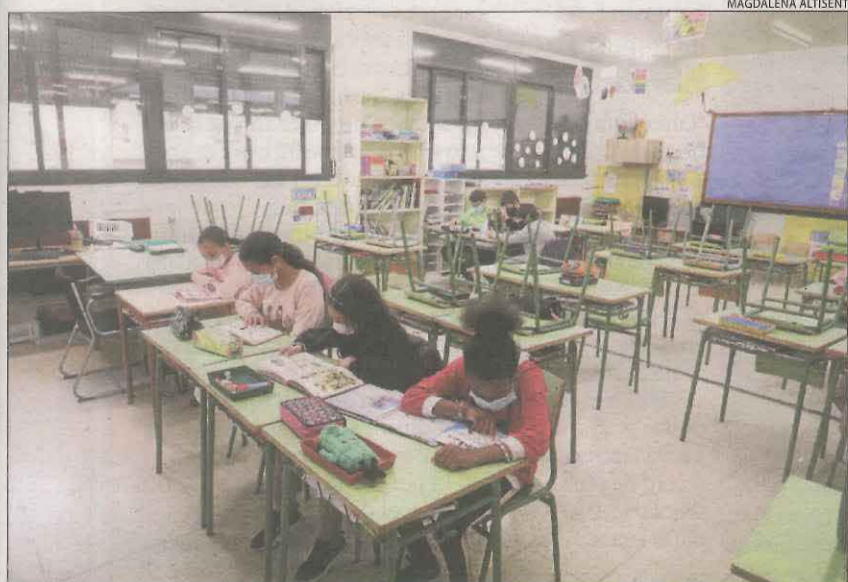
Una aula gairebé buida al col·legi Frederic Godàs.