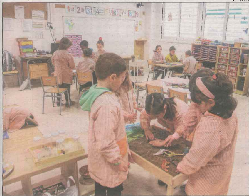
Nens del col·legi Maria-Mercè Marçal de Tàrrrega, a classe.