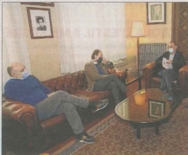
Una imatge de la reunió d'ahir amb l'alcalde de Lleida.

El projecte, que també compta amb el suport de la Clínica MiNovaaliança, es presentarà públicament en una gala benèfica que tindrà lloc el proper 22 d'abril a les Caves de Raimat i que inclourà també sortejos d'experiències, subhasta d'obres d'art i actuacions per recaptar fons per a aquesta iniciativa inclusiva.