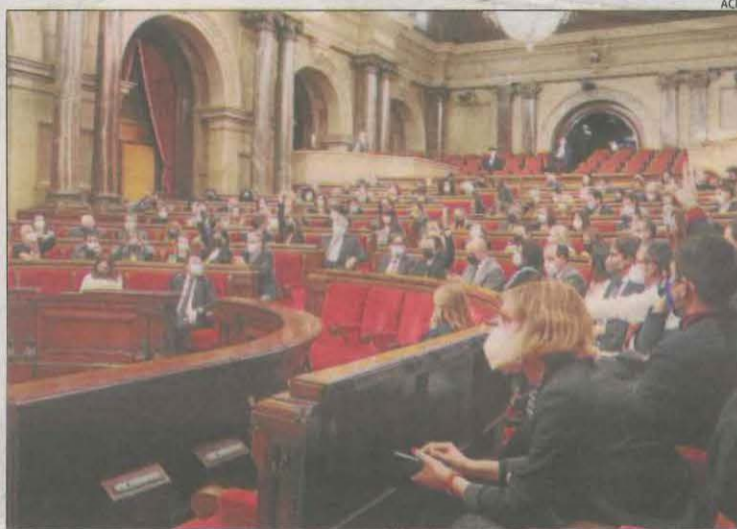
El Parlament va aprovar ahir la modificació del decret.

Malgrat que s'aplana el camí per portar a terme la consulta popular, continua sense haver-hi acord en qui hi podrà participar. ERC considera que s'ha de mantenir la idea inicial anunciada el dia 22 de gener i és que votin les sis comarques de la vegueria de l'Alt Pirineu i Aran (Pallars Jussà, Pallars Sobirà, Alta Ribagorça, Alt Ur-