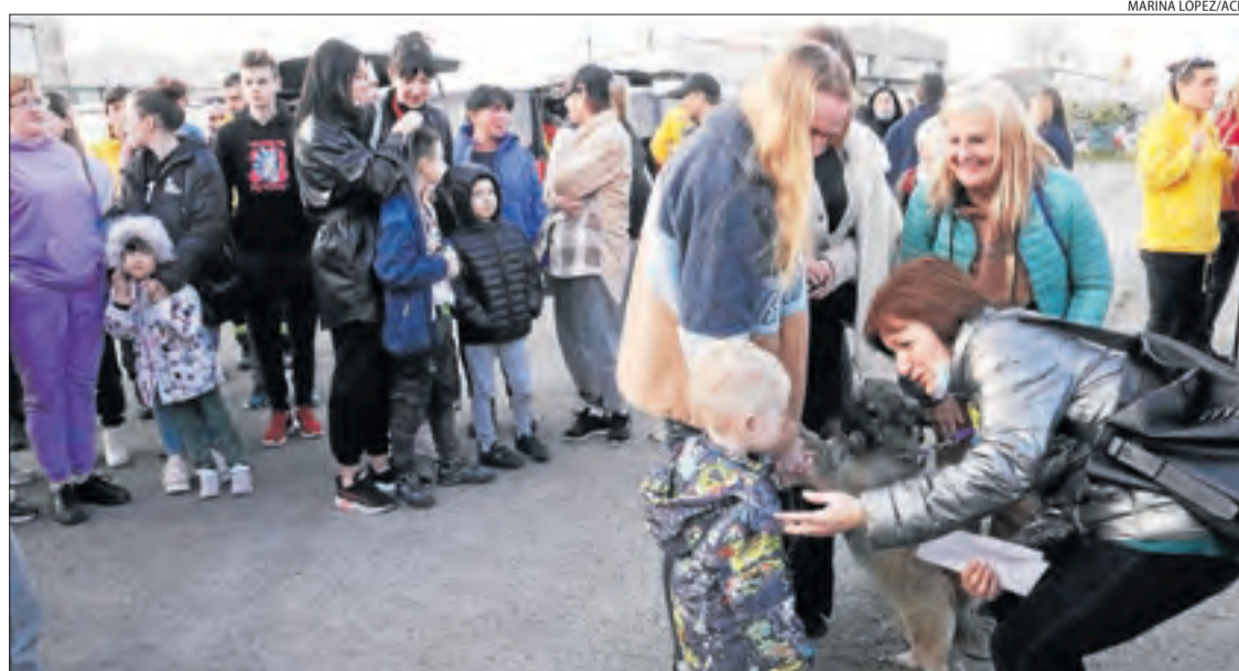
Una família procedent d'Ucraïna va conèixer ahir la família que l'acollirà a Girona.

Afirmen que, per exemple, deien que medicaven i preniën la tensió a ancians que feia diversos dies que havien mort.