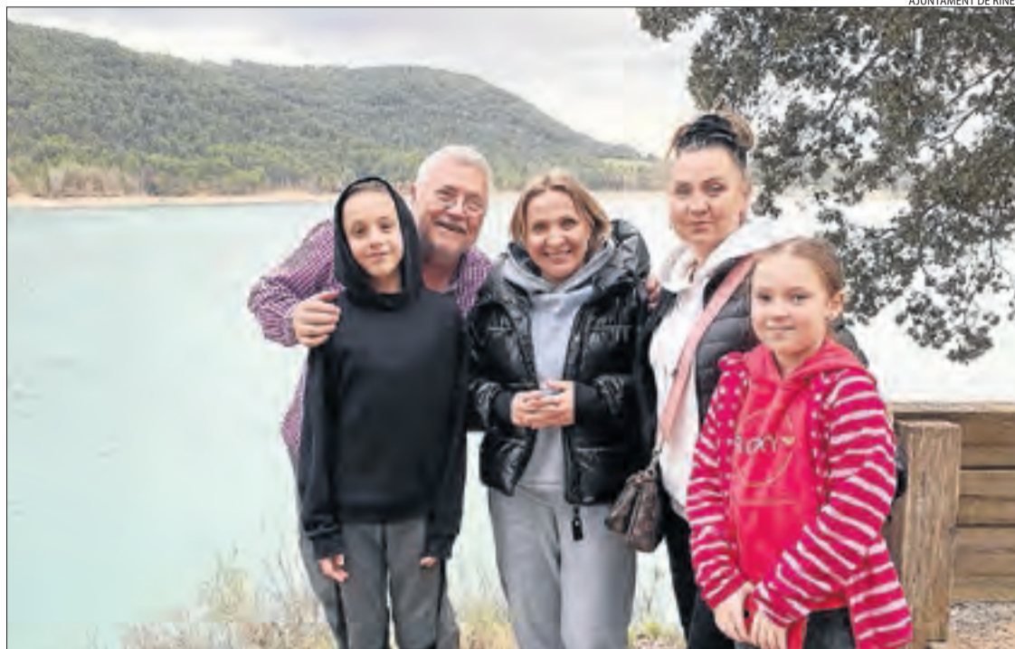
Imatge de la família de refugiats acollida a Riner, al pantà de Sant Ponç.

Després d'obtenir l'opinió de la comunitat ucraïnesa i escoltar les seues preocupacions en aquesta matèria, Salut es concentra en aquesta primera etapa del projecte en els menors d'edat. Fonts del departament van assenyalar que, fins ara,