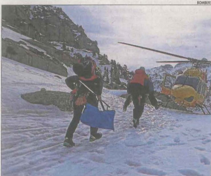
Moment del rescat ahir al matí de la senderista ferida.

| ABELLA DE LA CONCA | El Grup Especial de Prevenció d'Incendis Forestals (GEPF) i els Agents Rurals van fer ahir una crema controlada d'alta muntanya a Abella de la Conca, al Jussà, per regenerar pastures i per prevenir focs forestals.