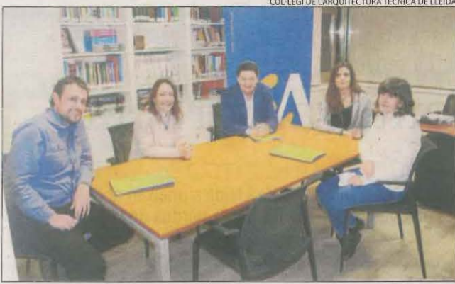
COL·LEGI DE L'ARQUITECTURA TÈCNICA DE LLEIDA