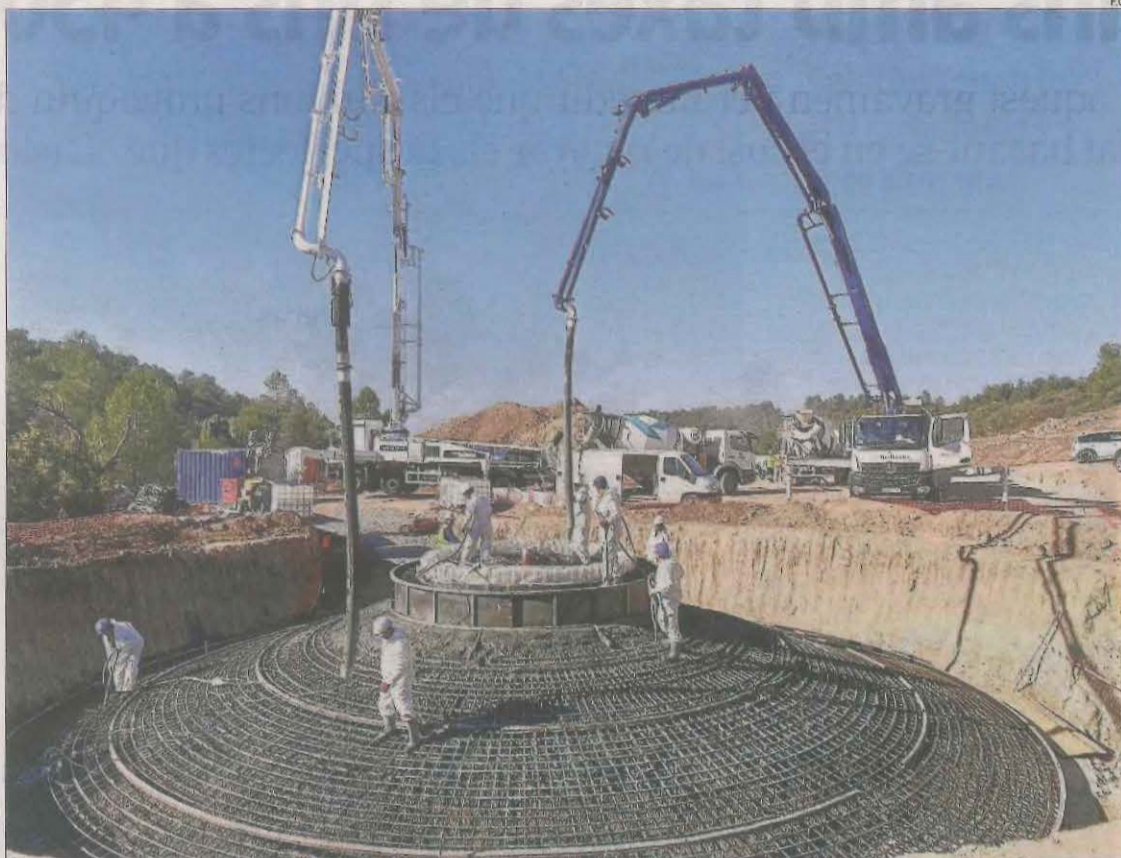
Imatge recent de les obres del parc eòlic de Solans.

També la planificació d'Ossó de Sió, que estableix distàncies mínimes entre instal·lacions d'energies renovables i nuclis habitats, està en tramitació davant d'Urbanisme. Talarn i la