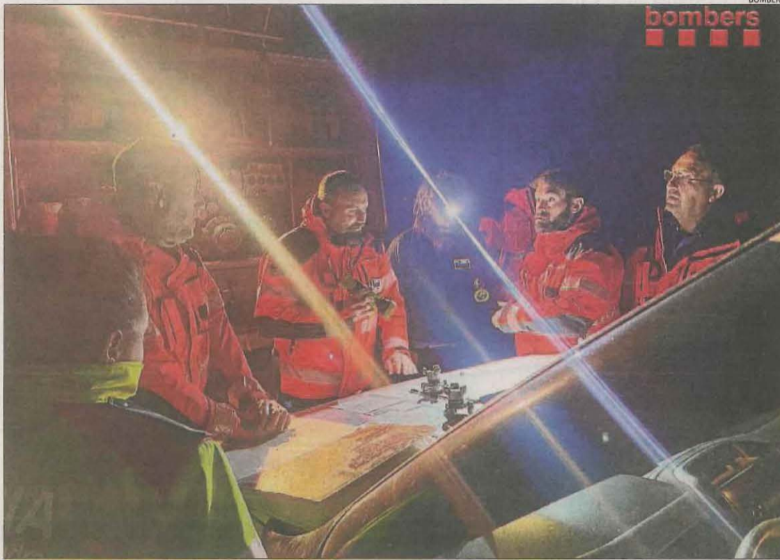
Bombers i Mossos planificant la recerca dilluns a la nit.

Els Bombers de la Generalitat van activar durant l'any passat un total de 87 recerques de persones desaparegudes a les comarques de Lleida.