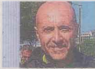
ÒSCAR BALSELLS CONSULTORIA RESTNEIGE

LA DIPUTACIÓ de Lleida, amb la col·laboració del Patronat de Turisme, ens va encarregar un projecte que consistia en la creació de producte turístic per a les comarques del Pirineu de la província, tot plegat gràcies als ajuts europeus (PECT). El mirador de Roca Regina va ser una de les 22 propostes que vam presentar uns mesos més tard i una de les 4 proposades per a la comarca del Pallars Jussà. Aquest projecte estava enquadrat en el tercer nivell dels cinc de creació de producte que vam establir.