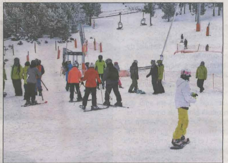
Imatge d'arxiu d'uns esquiadors a les pistes de Port Ainé

Aquest diari va intentar contactar, sense èxit, amb els presidents dels Consells de l'Alta Ribagorça i de l'Alt Urgell. Per la