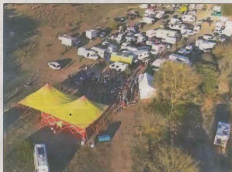
Imatge de la zona on es va fer la festa il·legal

Una persona va resultar ahir ferida de caràcter greu quan el cotxe que conduïa va patir una sortida de via al quilòmetre 4,5 de la IPU-9, al Poal, i va bolcar, a les 7.48 hores. Així mateix, cal indicar que a les 12.01 hores es va produir un accident entre un camió i un cotxe al quilòmetre 227,8 de l'N-260, a la Seu d'Urgell, i va haver-hi un ferit lleu.