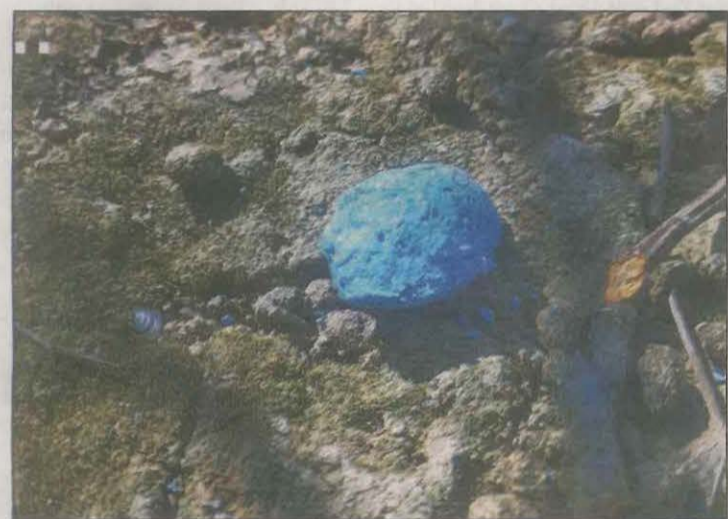
Una bola de verí localitzada en el camp de Bellpuig

Els tres joves, dos d'ells menors d'edat, detinguts dissabte pels Mossos d'Esquadra com a presumptes autor d'una pallissa a un jove de 28 anys d'Almacelles la matinada de divendres a dissabte es troben en llibertat amb càrrecs a l'espera de ser citats pel jutge. En aquest sentit, segons van explicar ahir fonts de properes al cas, un dels menors va quedar en llibertat després de declarar dissabte a la comissaria de la policia catalana, mentre que l'altre menor ho va fer diumenge. Així mateix, el tercer arrestat va passar també diumenge a disposició judicial. Els fets van tenir lloc al voltant de les 3.50 hores, moment en què els Mossos van ser alertats que s'estava produint una baralla al carrer Major d'Almacelles amb la participació de diversos joves. El ferit va ser traslladat en estat crític a l'Arnau on està en coma induït.