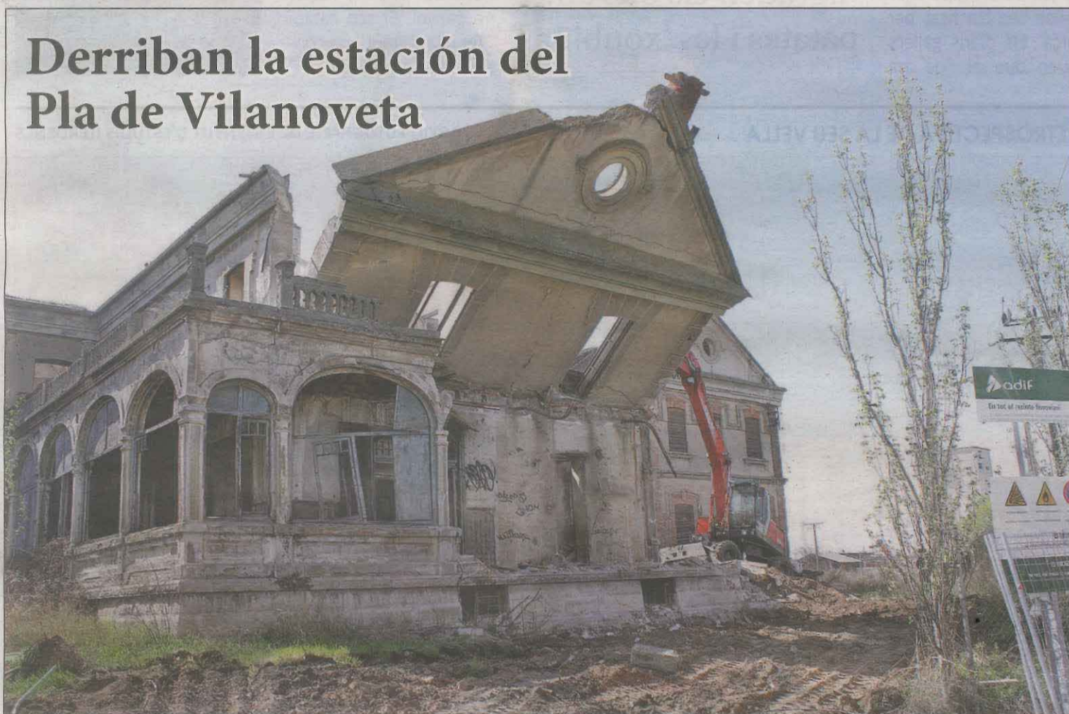
Los edificios, que fueron construidos hace cien años, se encontraban en un estado ruinoso y constituían un peligro | PÁG. 8