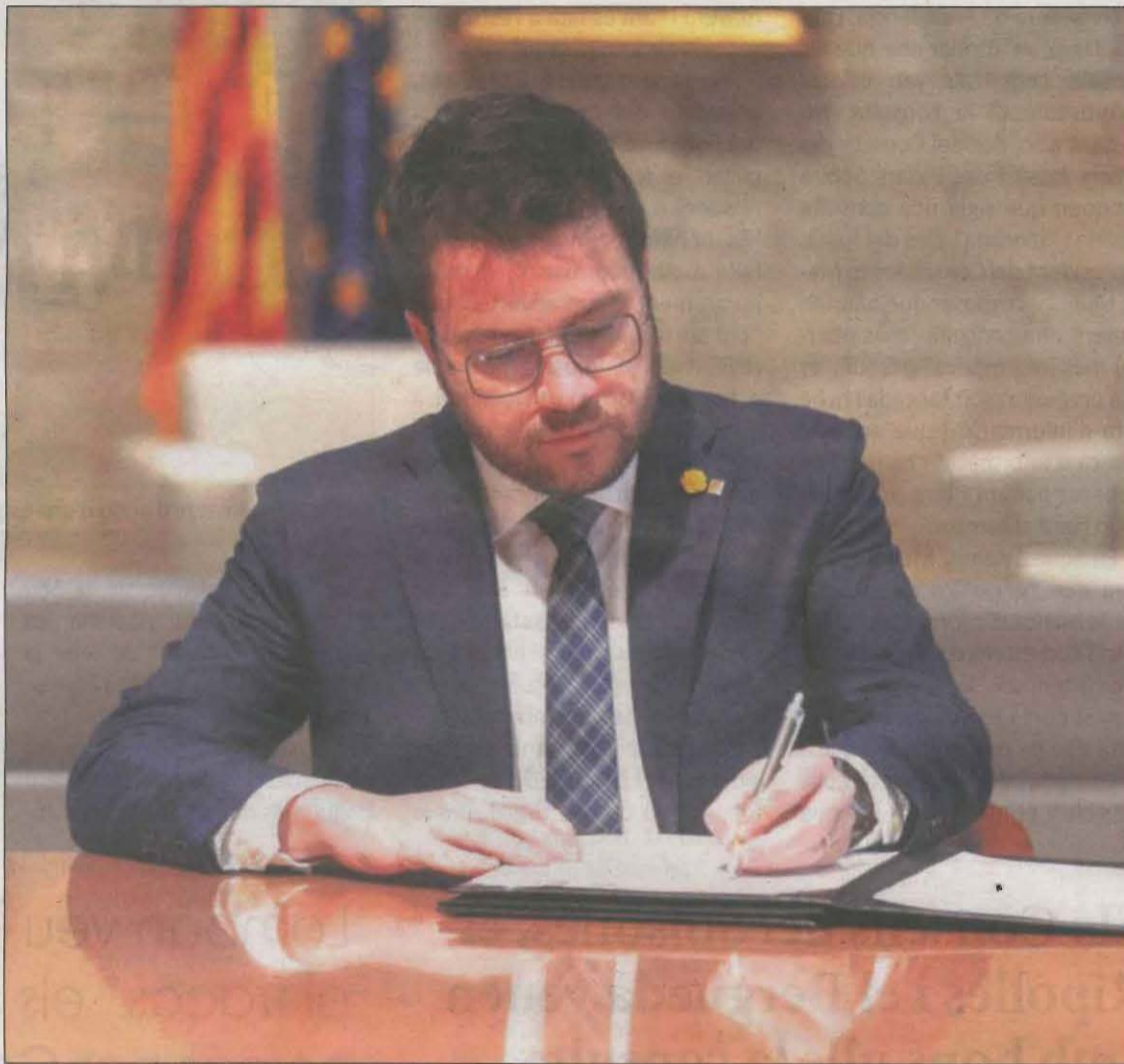
El president de la Generalitat signant el decret de convocatòria de les dues consultes pels Jocs

Vilagrà va fer una distinció entre l'Alt Pirineu i l'Aran, que tenen un "impacte territorial directe", i les altres tres comarques (Berguedà, Ripollès i Solsonès) que, segons la consellera, estan "indirectament afectades" però també han de tenir "un paper". La consellera va afirmar que hi ha una "preparació prèvia" als Jocs d'hivern i que les comarques del