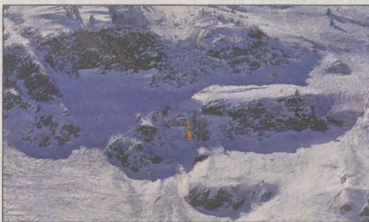
Moment en què els Bombers estaven al lloc de l'allau

el corresponent protocol i fins al lloc es van desplaçar dos efectius del Grup de Rescat en Muntanya (GRM) dels Bombers d'Aran amb un helicòpter, una dotació terrestre i una ambulància del cos. A més, en arribar el jove havia estat rescatat pels pistes de Baqueira Beret, tot i que es trobava inconscient. Així doncs, es van fer les maniobres de reanimació i va ser traslladat en estat crític a l'Hospital de Vielha, on va morir. Es tracta d'una zona on freqüentment hi ha allaus i accidents d'esquiadors.