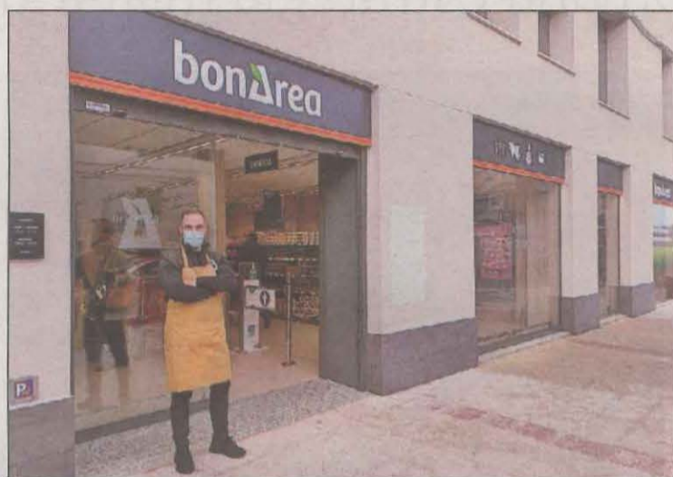
La companyia va fer públics ahir els resultats del 2021

"L'exercici 2021 ha estat un exercici molt atípic i complicat, amb incidència dels efectes de la pandèmia, l'encariment dels productes energètics i de les matèries primes", afirmava ahir la companyia en un comunicat. Pel que fa a la facturació es van