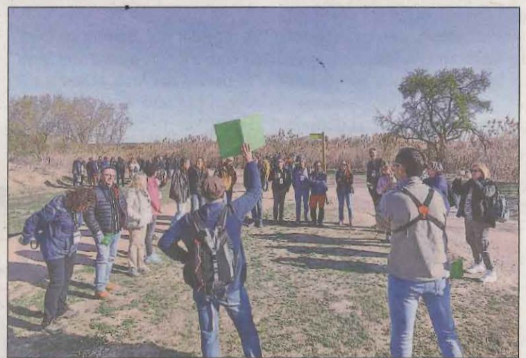
Una de les activitats realitzades en el marc del fòrum

Els factors relacionats amb el medi ambient, com la qualitat de l'aire o la proximitat als espais naturals, tenen un pes de més del 20% sobre l'estat de salut i la mortalitat de les persones, van explicar ahir els experts reunits en el III Fòrum d'Ecoturisme, Natura i Sostenibilitat (ENS), que es va clausurar ahir a Cal Sinén, a l'Estany d'Ivars i Vila-Sana. Aquesta trobada promoguda pel Departament d'Empresa i Treball ha esdevingut un punt de referència de l'ecoturisme a Catalunya. Ahir, Dia Mundial de la Salut, el Fòrum va oferir tallers de camp a l'aire en els que van participar més