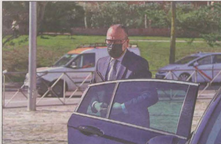
El conseller d'Esports del Govern d'Aragó, ahir