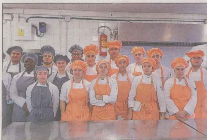
Alumnes que han participat en aquest cicle de formació

La plataforma Stop JJOO ja compta amb una entitat homòloga a l'Aragó, segons es va fer públic ahir dijous. El seu objectiu és reunir les veus crítiques a la candidatura dels Jocs d'hivern 2030 i demanar-ne la seva retirada. La nova plataforma es presenta amb un manifest que, sota el lema "Per un Pirineu Viu, Pel nostre futur STOP JJOO", vol que s'aturin els projectes d'ampliació de les pistes d'esquí de Canal Roya i la Vall de Castanesa i que es dirigeixin les inversions "a les necessitats del territori".