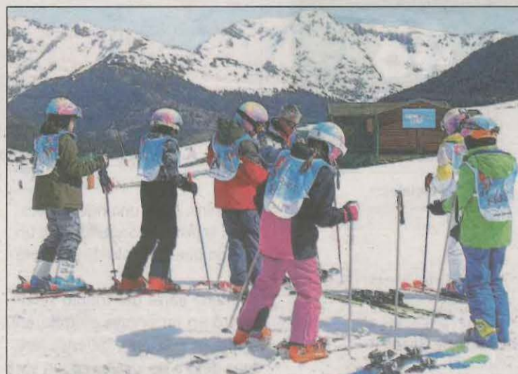
Participantes en las actividades

las tres jornadas celebradas en La Molina, la zona de Beret fue escenario de la última Graduació de Neu del curso 2021-2022, una clausura de carácter lúdico-competitivo donde el alumnado de 4º de primaria de estas comarcas demostró, a través de juegos y