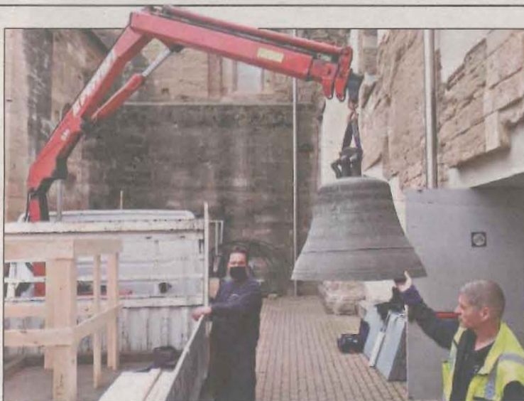
Imagen de los preparativos para transportar la campana

La campana, de un peso de 600 kilogramos y un diámetro de 87 centímetros, será reparada en el país centroeuropeo a los ocho años de haber sido descolgada. Se espera que en tres meses pueda volver a Lleida para volver a tocar los cuartos horarios. LOCAL | PÁG. 10