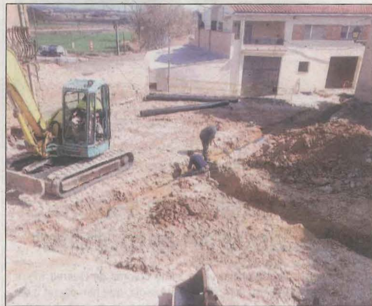
Les obres que s'estan fent per acabar les tasques de millora