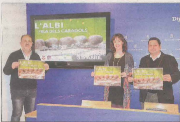
La Diputació va acollir ahir la presentació de la fira

El Comitè Olímpic Espanyol ha decidit mantenir la reunió prevista per avui per parlar de la candidatura de Catalunya i l'Aragó per als Jocs Olímpics d'hivern del 2030, malgrat l'anunci del president de l'Aragó, Javier Lambán, que no assistirà a la trobada per discrepàncies amb el projecte. Fonts del COE van confirmar a l'ACN que la cimera es manté malgrat la postura del govern aragonès, que presentarà una proposta alternativa amb un repartiment de proves olímpiques que considera més equitatiu.