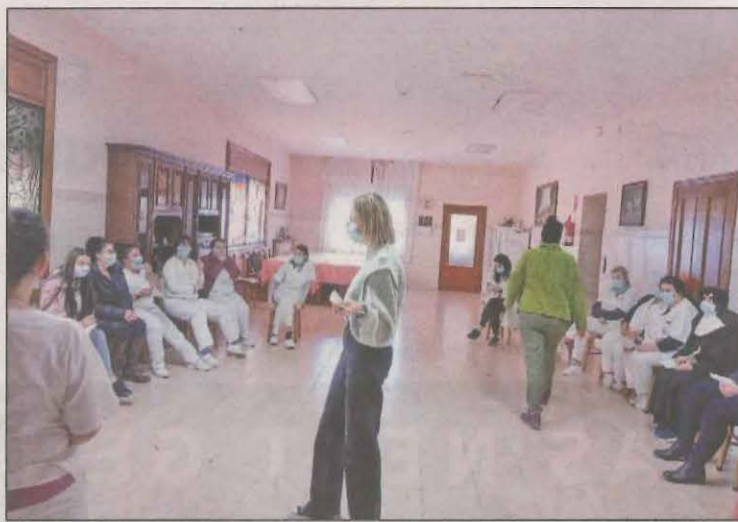
Una de les sessions formatives en una residència

tigar els efectes del confinament sobre els usuaris dels centres i, a la vegada, atendre les noves necessitats sorgides arran de la pandèmia. La formació se centra en el benestar emocional i la prevenció de la fragilitat i s'organitza en dos mòduls amb classes presencials de metodologia teòrico-pràctica basada en casos clínics.