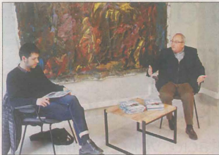
L'autor en la presentació d'ahir a La Fatal