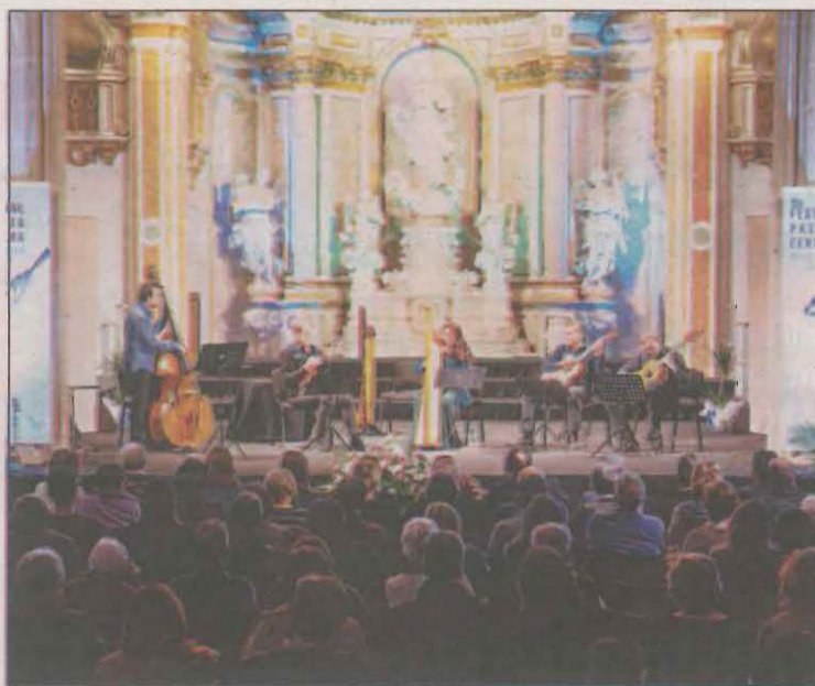
Dijous arrenca la segona setmana de concerts

El treball discogràfic "beu de l'estreta relació que mantenen des de sempre la poesia i la música, ja sigui en les cançons populars que tots reconeixem o en els versos dels grans poetes musicats per compositors de totes les èpoques, des de l'assolada Mediterrània fins la gèlida Escandinàvia", segons explicava Savall. D'aquesta manera, el grup