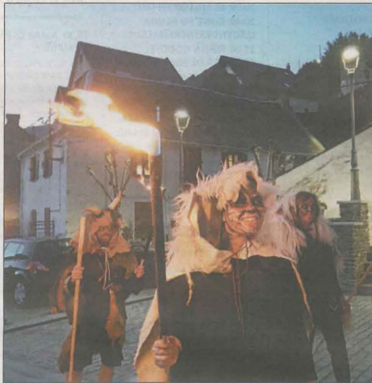
Una escena del nuevo audiovisual de Es Paums

Las escenas exteriores se han filmado en Canejan y en la zona de Quate Lòcs y Lairissa y las escenas interiores en la iglesia de