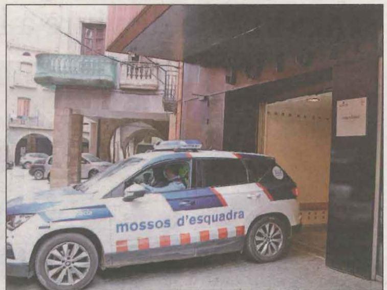
La parella a l'interior d'un cotxe dels Mossos

El Síndic va obrir una actuació d'ofici. A partir de les informacions rebudes de la Direcció General d'Atenció a la Infància i l'Adolescència (DGAIA) i del Con-