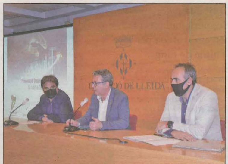
Moment de la presentació de l'Observatori 231

Els objectius són els següents: donar suport a les institucions i agents socioeconòmics, tant públics com privats, en la presa de decisions; esdevenir el termòmetre dels principals indicadors que incideixen en la província de Lleida; i aprofundir en el coneixement de la realitat socioeconòmica del territori. És un projecte innovador a la demarcació, en el sentit que fins ara no hi ha hagut cap eina que reculli totes les dades que ofereix aquest servei.