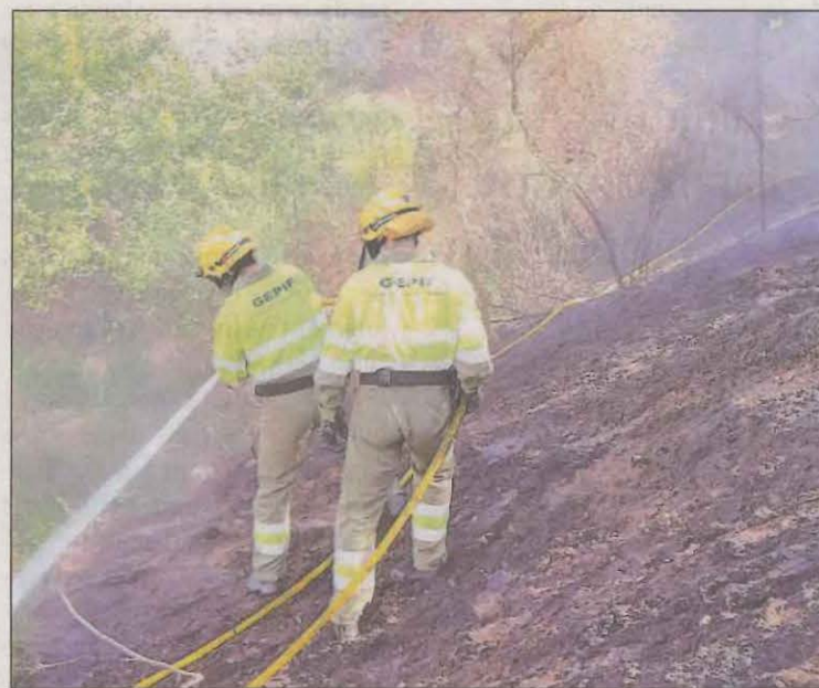
Membres del GEPIF remullant una zona cremada

Tremp ha incorporat un nou Grup Especial de Prevenció d'Incendis Forestals per executar treballs de prevenció d'incendis a les comarques lleidatanes. Aquest reforç està format per sis persones amb vehicles específics per fer tasques de prevenció i primera intervenció en incendis agrícoles i forestals. La nova unitat ja està operativa des d'aquesta mateixa setmana i fins a l'1 de juny faran tasques de manteniment d'infraestructures de prevenció d'incendis forestals. De l'1 de juny fins al 30 de setembre se centraran en la vigilància i primera intervenció en incendis. La incorporació s'emmarca en el Pla de prevenció d'incendis 2022-2025.