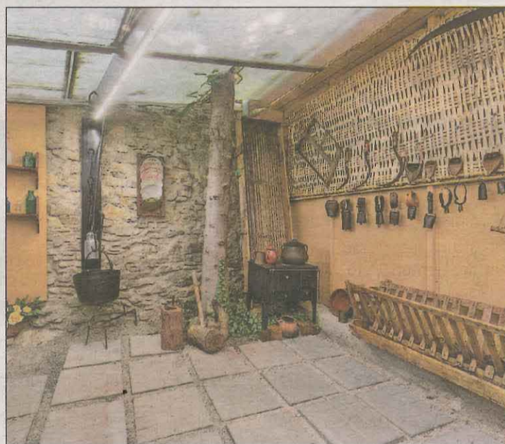
Eines i utensilis formen part de l'espai museístic