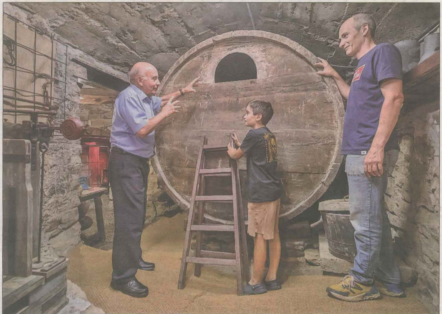
Durant l'estança també es pot visitar la zona del celler de Cal Soldat

A l'Espai d'Eines trobem més d'un centenar d'estrís molt diversos, entre els quals peces curioses com l'aparell del mesclat (on es