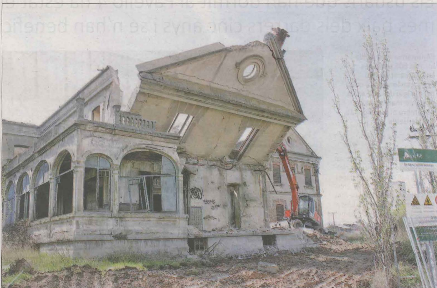
El dia 4 d'abril, per sorpresa, les màquines van fer acte de presència a l'Estació del Pla de Vilanoveta per enderrocar l'estació

La història del ferrocarril a Lleida, llevat de l'arribada de l'AVE, que connecta la ciutat amb alta velocitat amb Barcelona i Madrid, no és precisament una història d'èxit. El sistema de rodalies, com recorden les administracions i també sindicats com CCOO, brilla per la seva absència i el tren de la Pobla només ha pogut tirar endavant des que se'n va fer càrrec Ferrocarrils de la Generalitat. I és que la línia va estar al llindar del tancament durant molts anys. De fet, aquesta línia no deixa de ser una metàfora del que ha passat amb el ferrocarril a Lleida. Havia d'unir Lleida amb la població