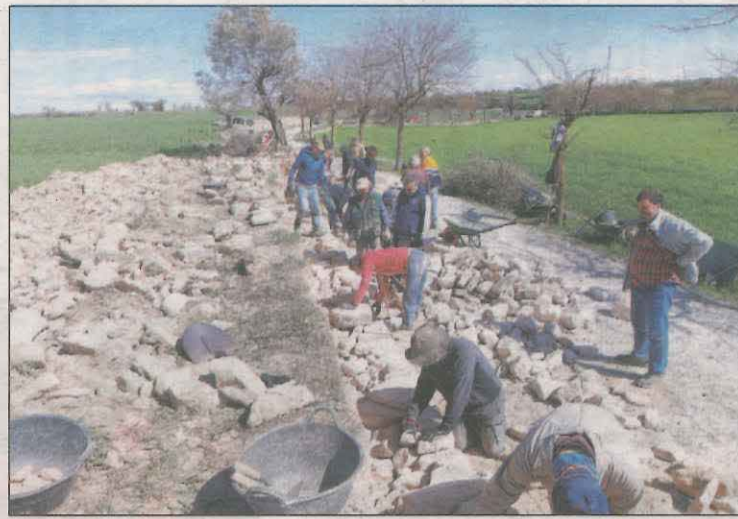
Reconstrucció d'un marge en el camí de l'Estany

El divendres dia 8, es va realitzar la conferència Marges de pedra seca: funció, tipologies i estructures associades , a càrrec del doctor Andreu Serés, biòleg i estudiós de l'arquitectura popular. Dissabte es va dur a terme