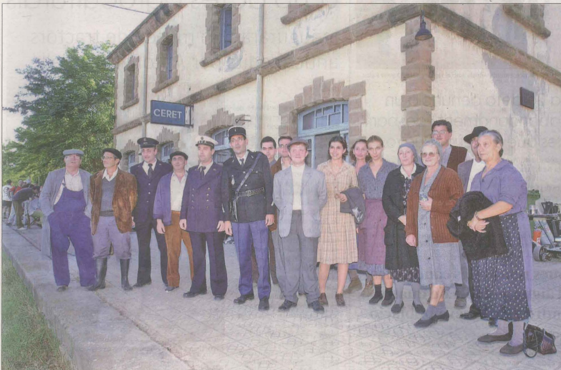
L'estació de Gerb va servir d'escenari per a la gravació del film 'El embrujo de Shanghai', de Fernando Trueba. Pocs mesos després es va enderrocar

← ve de la pàgina anterior • una icona pel creuament de vies que duen a camins diferents.