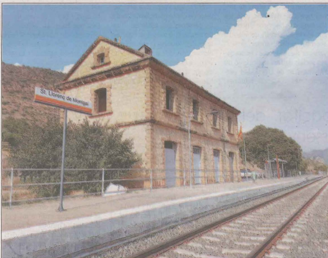
L'estació de Sant Llorenç, que van salvar els veïns l'any 2001, espera que se li doni un altre ús

francesa de Saint Gironès i es va quedar a la Pobla de Segur. Més o menys el mateix que li va passar a la línia de Canfranc, que també havia de travessar el Pirineu i que finalment s'hi va quedar a les portes.