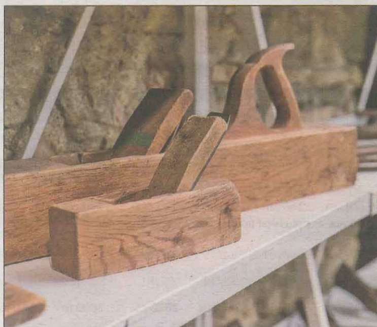
Les eines tradicionals també tenen el seu espai propi