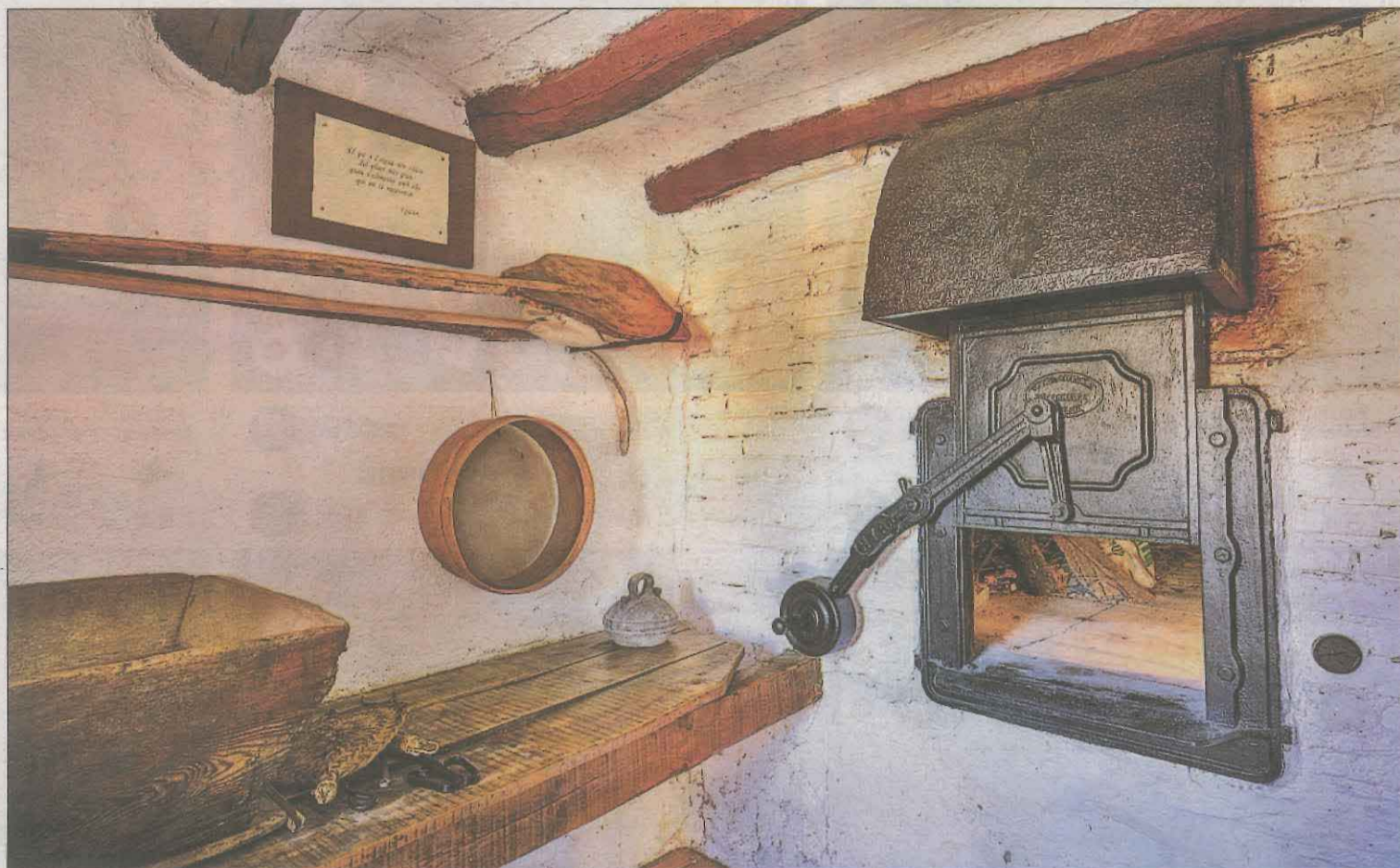
Imatge d'un antic forn de calç que es pot veure en aquest allotjament rural

Però Cal Soldat no circumscriu l'oferta cultural a la visita a l'Espai Museum. Els propietaris organitzen amb regularitat tertúlies sobre la situació socioeconòmica d'un territori, el Pallars Jussà, ric en cultura i natura, però que pateix el despoblament i la fugida de la joventut a les ciutats. "No només volem preservar el llegat de la gent que va viure en aquesta terra, també ens agradaria contribuir a garantir un bon futur per a les persones que hi viuen i que hi viuran".