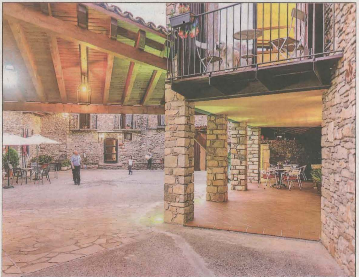
Vista general de tot l'allotjament de Cal Soldat, al poble de Collmorter

Al Celler hi destaquen els dipòsits d'oli i les botes de vi (inclòs un bocoi monumental apte per a 2.500 litres). Al costat d'aquest espai trobem una zona per degustar vins i productes de la terra, la