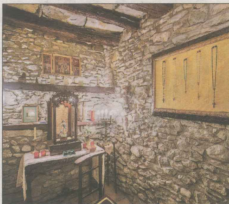
El complex també té un oratori propi