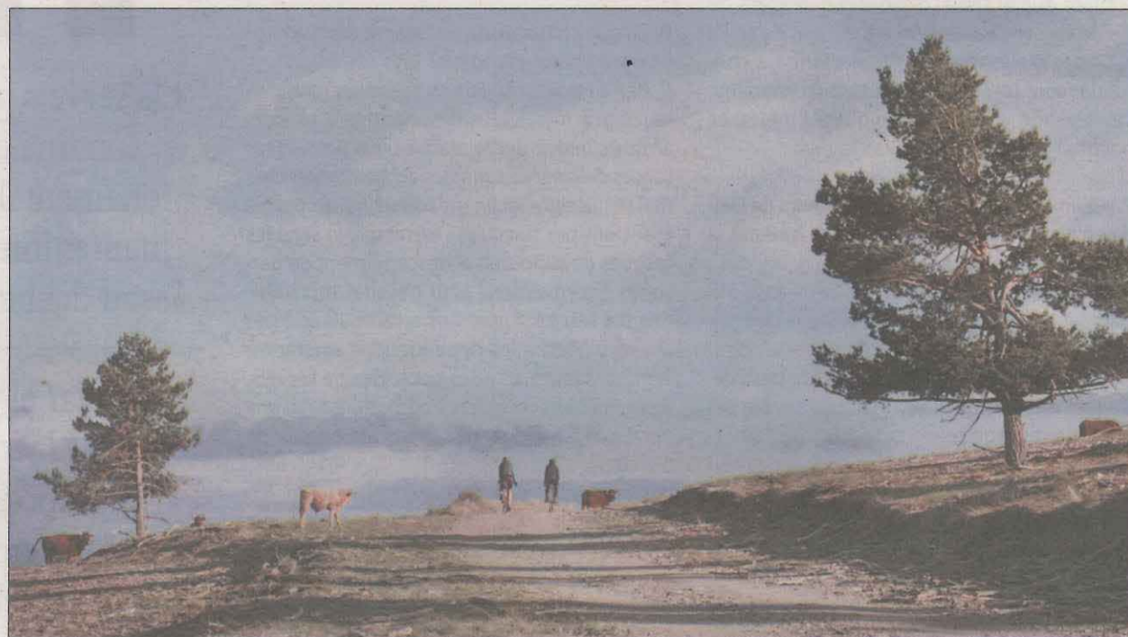
Fent la travessa de segur ens trobarem amb vaques pasturant, cabirols, senglars o guineus

concepte de sostenibilitat i cura del medi ambient, per això s'anima a que els visitants facin ús del tren per accedir al Pirineu, el Tren de la Pobla o Tren dels Llacs. Si es contracta la ruta i s'arriba en tren l'empresa regala el bitllet de tornada a la ciutat de Lleida. També a la mateixa estació de tren s'ofereix assistència gratuïta per la bici. La Ruta Fera Gravel Pirineus amb sortida i arribada a la Pobla de Segur porta al turista fins a les poblacions de Senterada, Pont de Suert, Vilaller, Vielha, Bossòst, Bagergue, Montgarri, Esterrí d'Àneu, Espot, Sort, Sant Joan de l'Erm, Civís, la Seu d'Urgell, Noves de Segre, Taús, i Gerri de la Sal. Pedalejant per muntan-