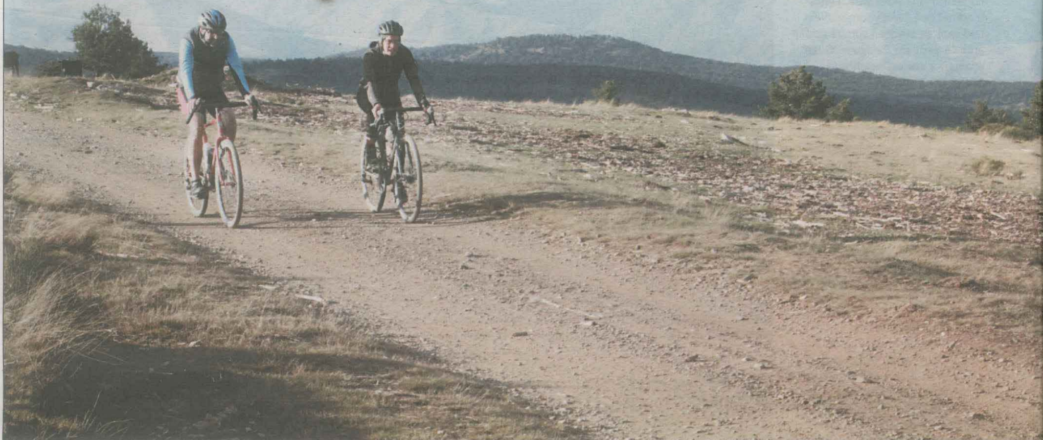
Dos ciclistes pedalant per la Ruta Fera Gravel Pirineus, que compta amb el suport del Patronat de Turisme de la Diputació, uns dies abans de l'estrena oficial

Aquesta nova ruta turística de 506 quilòmetres arranxa l'1 de juny