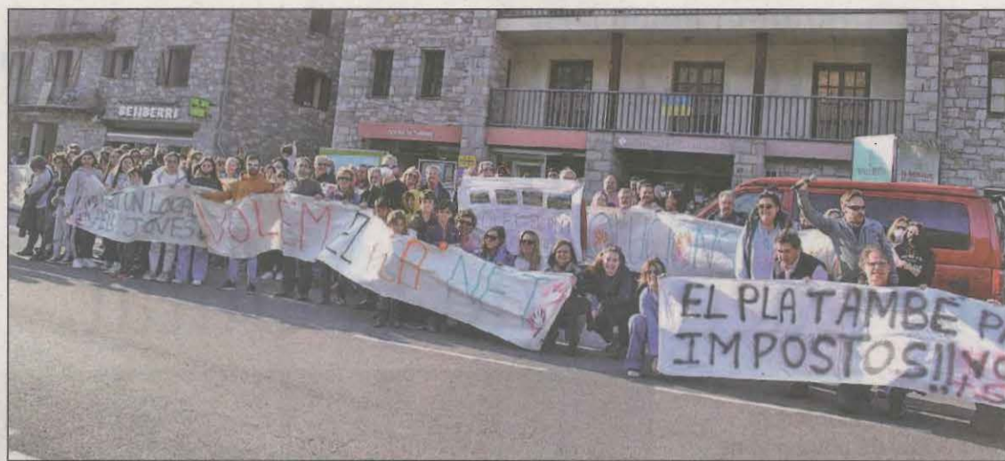
Uns 200 veïns es van manifestar i van fer una marxa lenta de vehicles i amb pancartes

El GRAE de Bombers van rescatar ahir un home de 67 anys que va patir una lipotímia arran d'un cop de calor quan es trobava a Sant Esteve de la Sarga, al Congost de Mont-rebei. L'avís a emergències es va produir cap a les 16.20 hores i va ser necessària la intervenció de l'helicòpter per auxiliar-lo.