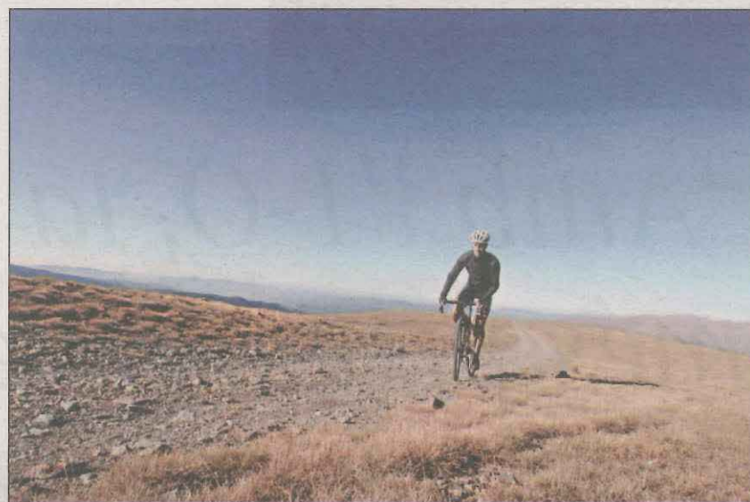
L'objectiu és gaudir del paisatge en tranquil·litat