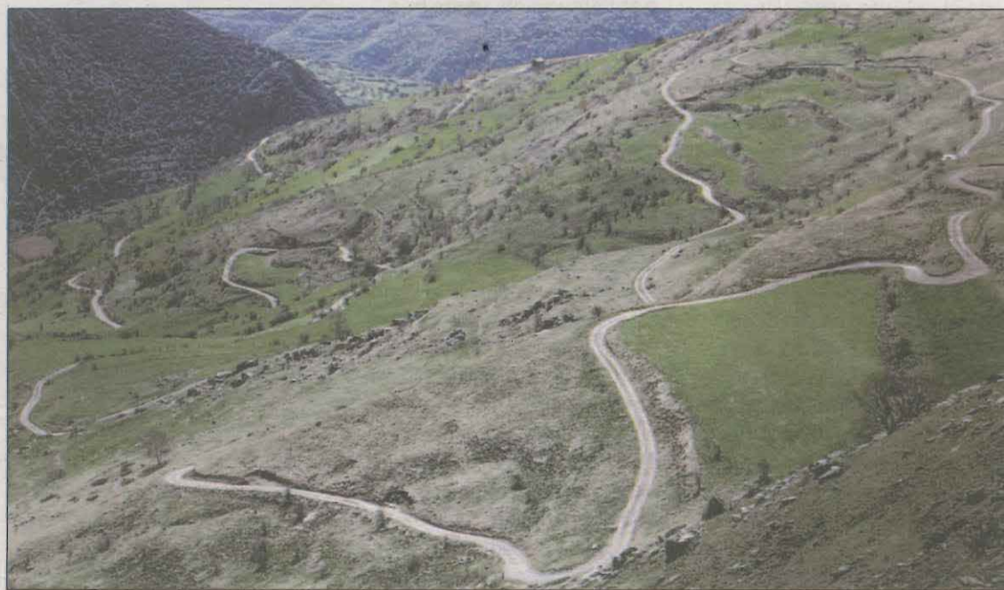
El recorregut passa per les muntanyes de Llessui

L'empresa també oferirà la possibilitat de fer una ruta de 300 quilòmetres o una altra de 200. De totes maneres, la idea inicial