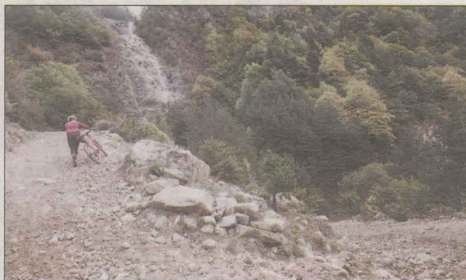
La pista del terme de Vilaller per on es passa