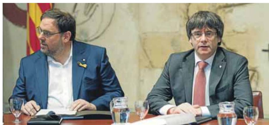
Puigdemont i Junqueras, en una reunió de govern l'octubre del 2017

■ Considera que 2,2 milions corresponen a acció exterior i 1,2 milions, a la preparació de l'1-O ■ Afecta 30 exdirigents