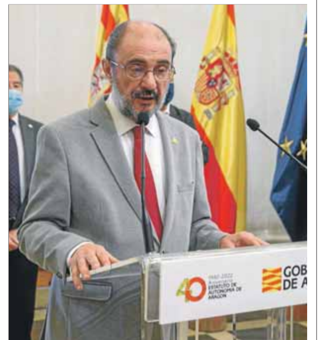
El president aragonès, Javier Lambán, ha canviat de parer sobre la candidatura olímpica

El president de l'Aragó insisteix que no llençarà la tovallola per fer valdre la nova proposta "en peu d'igualtat"