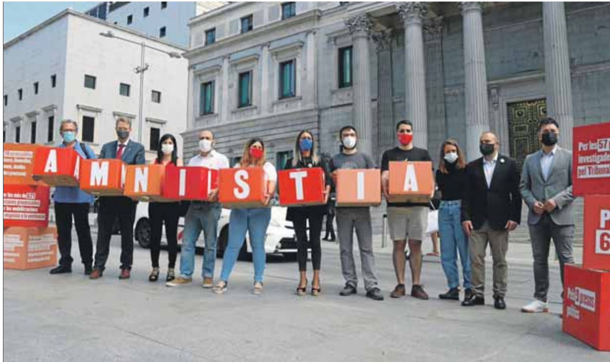
Diputats d'ERC, Junts, el PDeCAT i la CUP el 21 de juny, amb les firmes recollides per Òmnium i Amnistia i Llibertat

La via d'actuació per sortir de l'actual atzucac