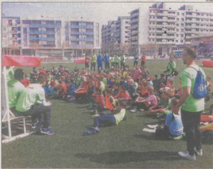
Porters de totes les edats en una edició anterior del torneig.

'Guants d'Or' és la nova denominació de la 'Batalla de porters' que es va fer per última vegada el 2017