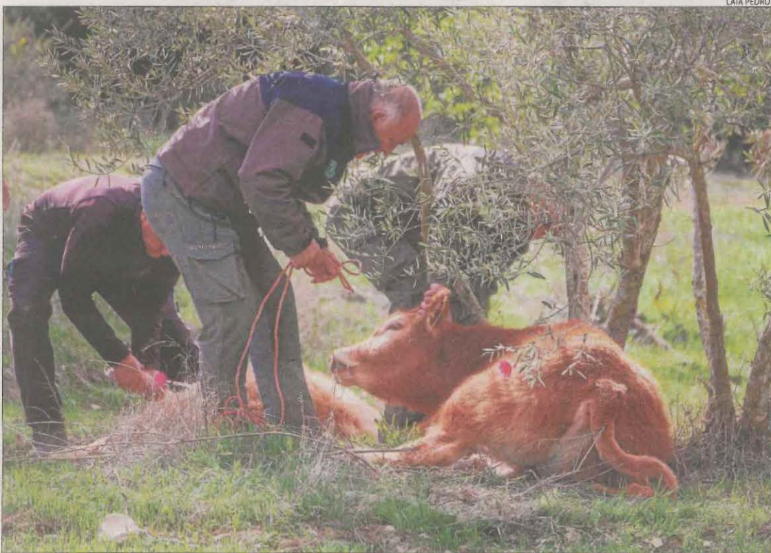
Rurals van capturar ahir a la tarda diversos exemplars sedats amb dards.

Els Rurals van iniciar l'operatiu a les 8.00 hores, comptant amb la unitat de drons (RPAS). Durant el matí van localitzar una vintena de vedells que van capturar després d'acorrallar-los. Davant la dificultat d'atrapar la resta d'animals —a les 14.00 hores encara n'hi havia 33 de lliures—, a la tarda els van disparar dards sedants a mesura que els localitzaven. Els van lligar les potes per evitar que s'escapessin, els van carregar