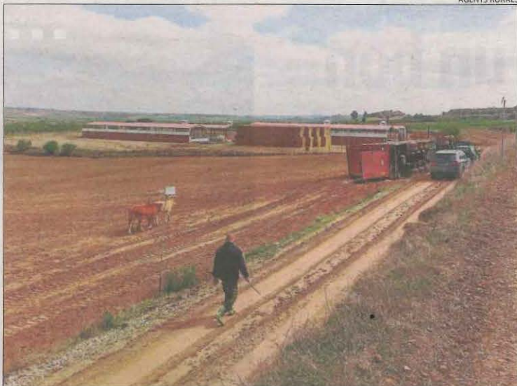
El camió transportava 108 vedells a una granja a Vilagrassa.

Val a recordar que a finals de l'any passat els Rurals van treballar durant més de tres setmanes en la captura de 14 vedells que pasturaven en llibertat al fugir d'una granja d'Algerri. En el cas de l'Urgell, els Rurals van destacar que els cultius tot just han començat a créixer i és més fàcil localitzar els animals que busquen amb cotxes patrulla, prismàtics i drons.