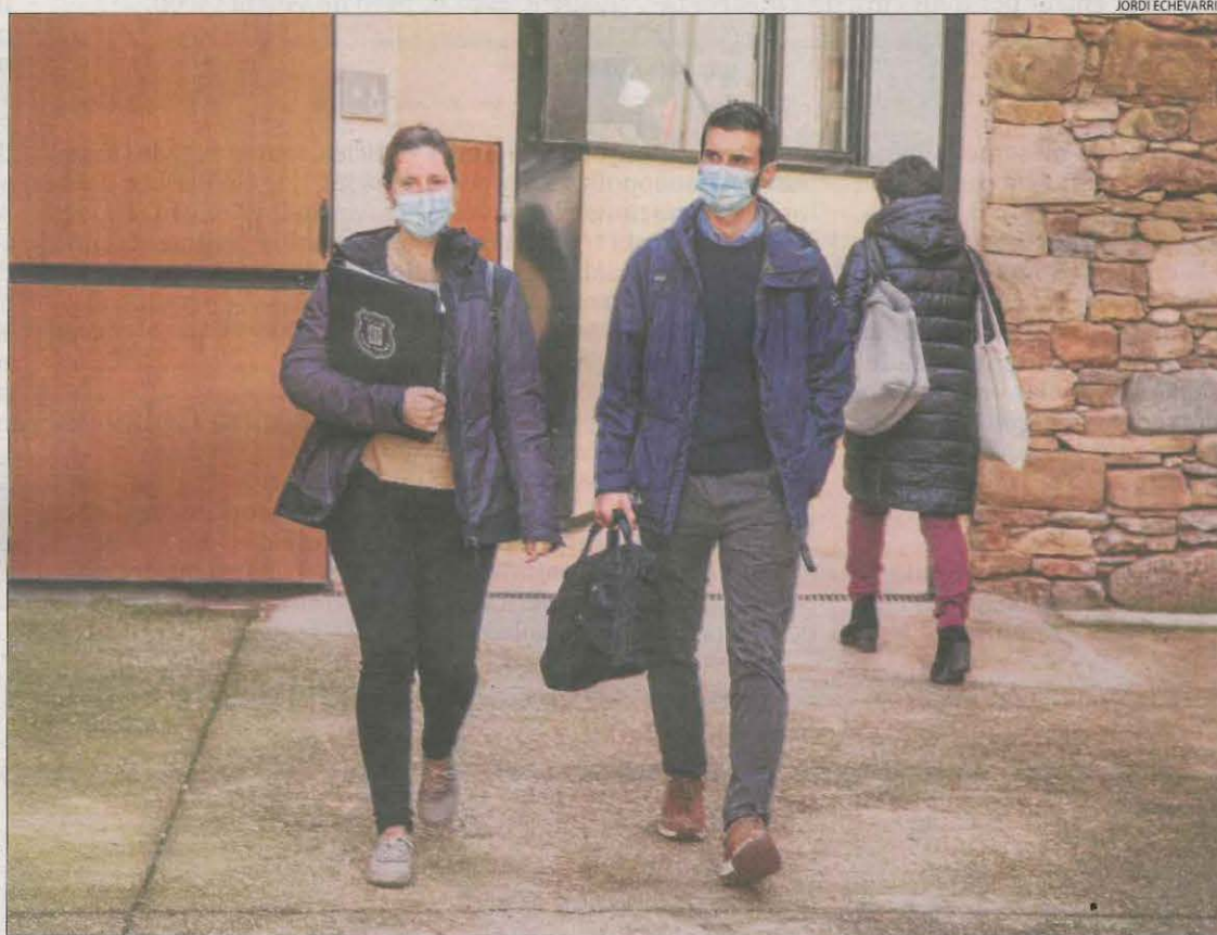
Imatge de dos mossos d'esquadra ahir a la sortida del jutjat de Tremp.