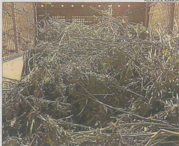
Vista de la plantació localitzada en una nau de Montclar.

MONTCLAR | La Policia Local d'Agramunt ha detingut dos veïns de Montclar per tenir en una nau de la seua propietat una plantació indoor de marihuana amb més de 400 plantes. Els agents van fer una inspecció a la nau al detectar obres sense autorització i a l'entrar van descobrir la plantació. Els dos detinguts van ser traslladats a la comissaria dels Mossos de Balaguer perquè passessin a disposició del jutjat.