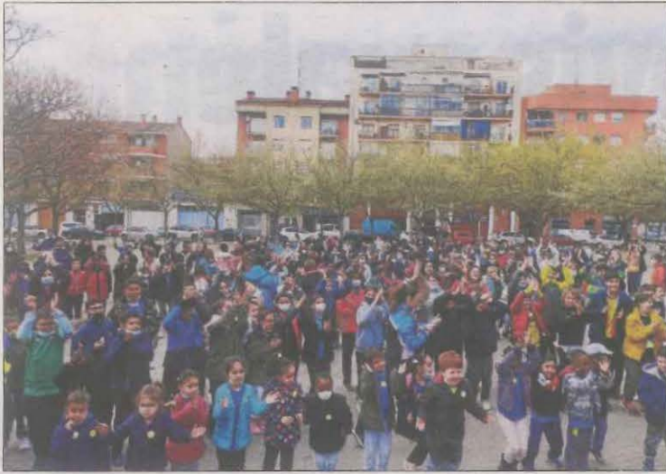
La caminada de 300 escolars va acabar a la plaça de les Magnòlies.