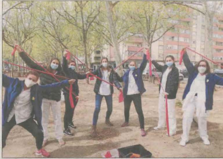
Infermeres durant una activitat dirigida a Cappont.