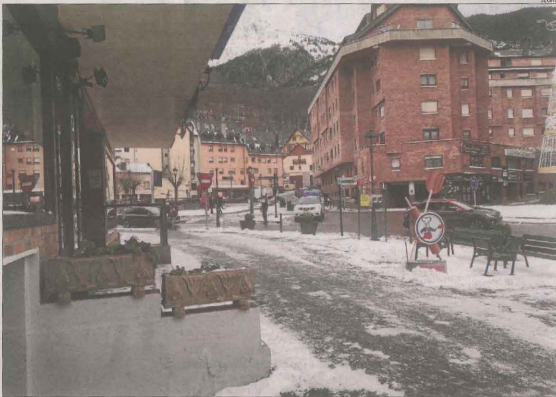
Vielha, a la imatge, es contemplava als informes previs com a seu d'una vila olímpica.

Els informes ja mostren la falta d'infraestructures per a les proves de salt i de circuit de gel, així com les dificultats per