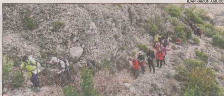
El grup a l'Ermida de Montalegre (Serra del Mont-roig).