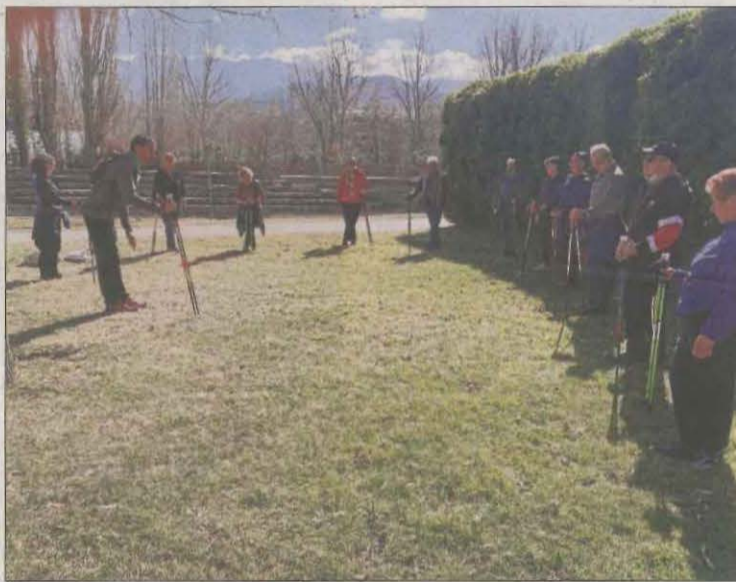
Caminada a la Seu d'Urgell.

Així mateix, s'han organitzat caminades en diverses poblacions de la província, mentre que a Ponts es va celebrar un joc de pistes al barri antic. Les propostes per fomentar l'exercici físic seguiran aquest cap de setmana, amb l'organització d'una jornada d'activitats per part de diversos clubs esportius al parc de la Transsegre de Balaguer, o una caminada seguida d'una classe de zumba i una sessió de ioga a Alfarràs, entre altres iniciatives. Al Pirineu, localitats com Oliana, Tremp , el Pont de Suert o la Pobla de Segur també s'han afegit a la celebració amb variades activitats.