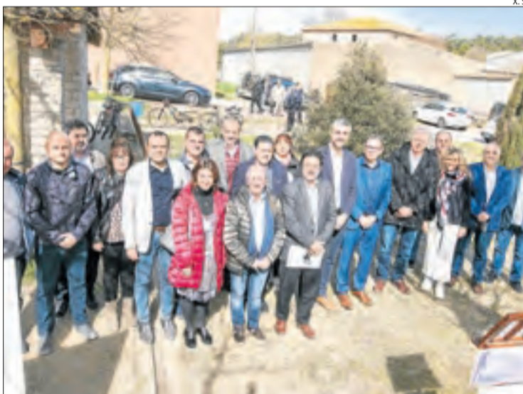
Gavín, Solé i Talarn, amb alcaldes de la Ribera del Sió ahir a Gàver.

El delegat de la Generalitat a Lleida, Bernat Solé, va destacar el valor d'aquesta iniciativa per revertir la despoblació de muni-