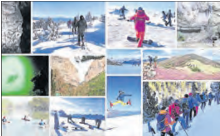
Un col·lectiu de 15 professionals forma uns 930 alumnes.

|| L'Institut Centre d'Esports de Muntanya del Pallars, amb seu a la Pobla de Segur, estrena el tercer nivell de piragüisme