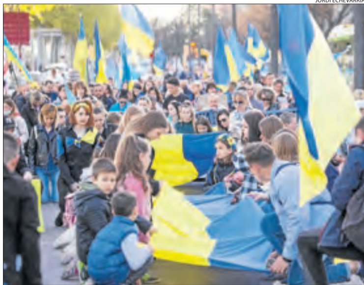
La manifestació contra la guerra a Lleida ciutat i, a la imatge de la dreta, el ball dels gegants i capgrossos a Guissona.

[LLEIDA] Lleida va viure ahir una nova jornada de protesta contra la guerra a Ucraïna. A la capital del Segrià, més de quatre-centes persones van participar a la tarda en una manifestació convocada per la comunitat ucraïnesa. Durant la marxa, que va sortir des de la plaça Ricard Viñes, els assistents van retre homenatge a totes les persones que han perdut la vida des que va començar la guerra, el 24 de febrer. Van clamar contra la invasió russa i van exigir “més sancions” i “més armes”. De la mateixa manera, van demanar “castigar els assassins”, “parar els negocis amb Rússia” i “salvar la gent de