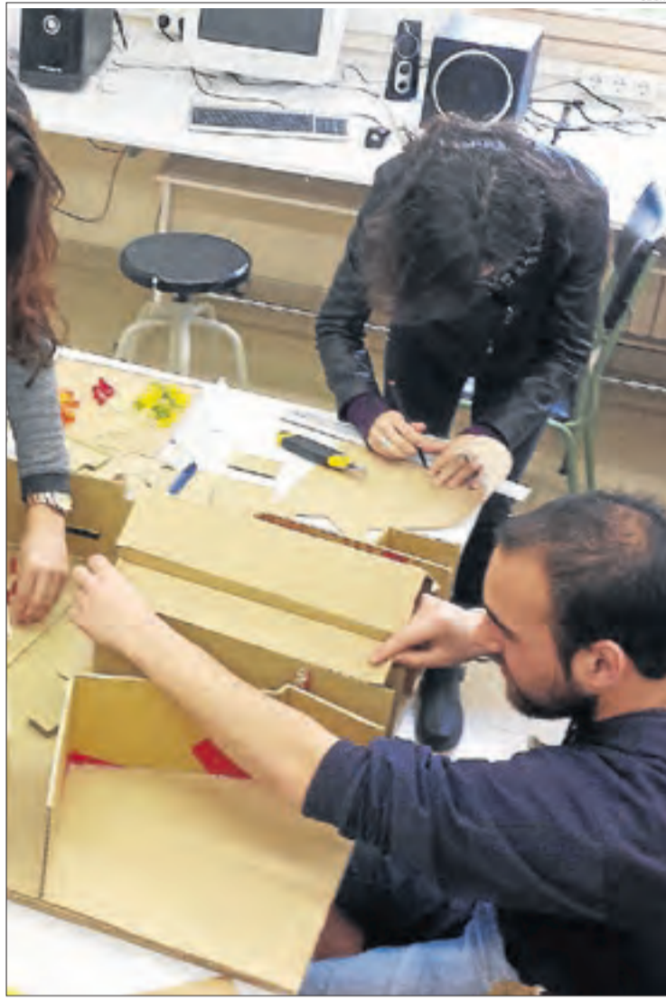
A Lleida uns 243 alumnes cursen arts plàstiques i arts escèniques.

seny, forma en una quinzena de disciplines com la ceràmica, vidre, escultura, tèxtils artístics, joieria i comunicació gràfica. A comarques, l'EA Ondara de Tàrraga amplia l'oferta amb un nou cicle de revestiments murals, que se suma al cicle de grau mitjà en assistència al producte gràfic interactiu (a cursar bé separat o conjuntament amb el batxillerat artístic), alhora que ofereix el superior en escultura gràfica i publicitària i ceràmica. El grau superior monopolitza l'oferta de l'escola Leandre Cristòfol de Lleida, amb vessants com l'animació, fotografia professional, il·lustració, arquitectura efímera, o gràfica publicitària.