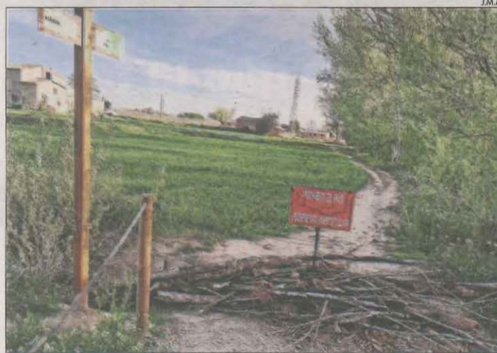
Imatge dels troncs i el senyal de "prohibit el pas".