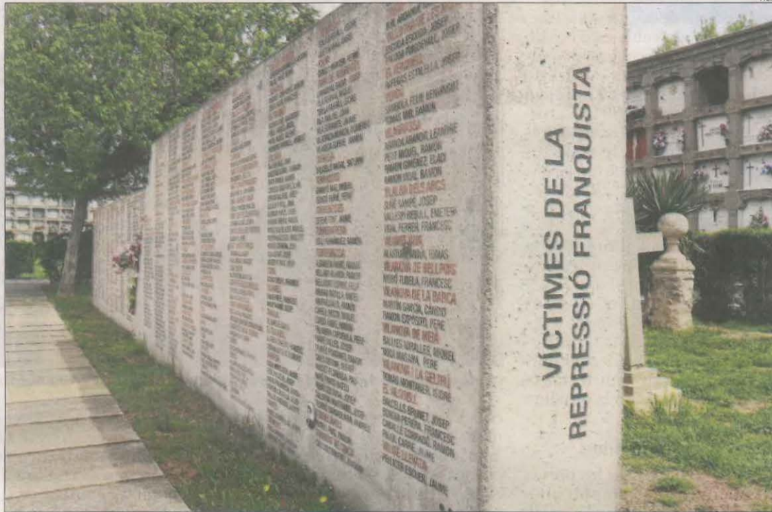
Monument dedicat a les víctimes del franquisme al cementiri de Lleida.

Una vegada recopilades les dades, se celebrarà un acte públic de reconeixement a les víctimes en el qual se'ls entregarà el document que acredita la nul·litat de la sentència. Preveuen que l'acte se celebri al juliol a la Seu Vella.