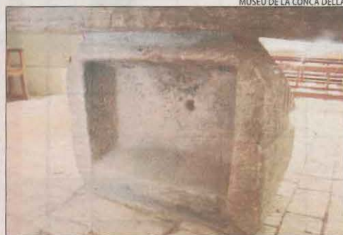
L'altar havia estat una pila de safareig.

Com pot veure's en aquestes imatges, l'operació de rescat a finals de març va necessitar una grua per poder desplaçar