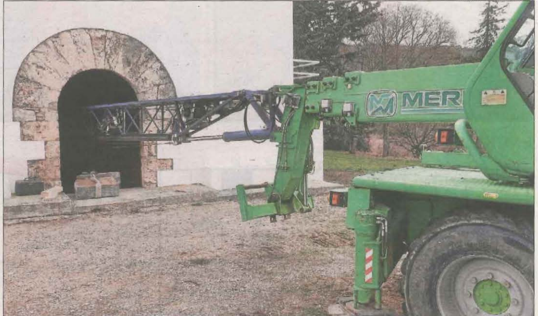
Imatge d'arxiu de l'altar de pedra de la Mare de Déu de la Posa, a Isona, i l'operació de trasllat del bloc amb grua inclosa.