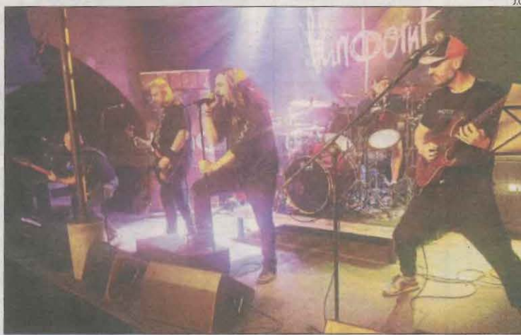
Els lleidatans Blindpoint, en plena acció al Cafè del Teatre.

L'ocasió va venir que ni pintada, ja que la recent estrena d' A Technical Default convidava a conèixer en quin punt de forma es troben i si han variat les seues armes ja conegudes. Doncs la grata sorpresa ha estat la seua col·laboració amb estudiants de gràfica publicitària de l'Escola d'Art Ondara de Tàrraga, que han creat l'estètica del