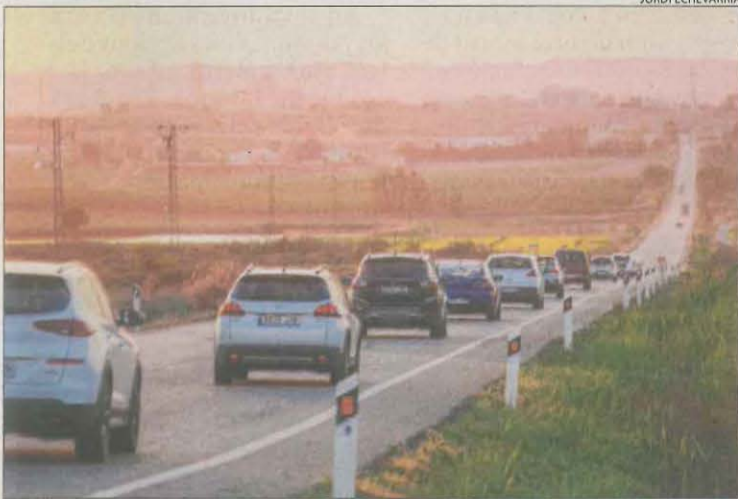
Cotxes ahir a la tarda a l'N-240 en direcció a Lleida.