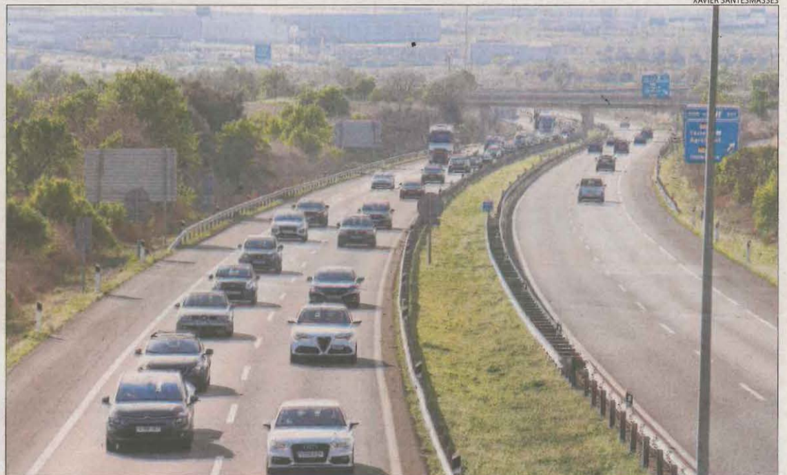
Imatge ahir de l'autovia A-2 al seu pas per Tàrraga.

només cal lamentar l'accident mortal de divendres passat a la C-26 a Balaguer. Un conductor de 86 anys de la capital de la Noguera va morir arran d'una col·lisió frontal.