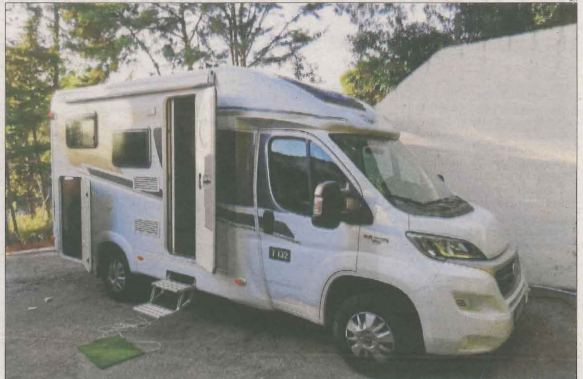
Imatge de l'autocaravana, una Carado T132 amb matrícula 6665-JVL.

La lleidatana va denunciar el robatori el mateix divendres davant dels Mossos d'Esquadra i també ha fet una crida a través del seu perfil a Instagram, on compta amb 10.600 seguidors