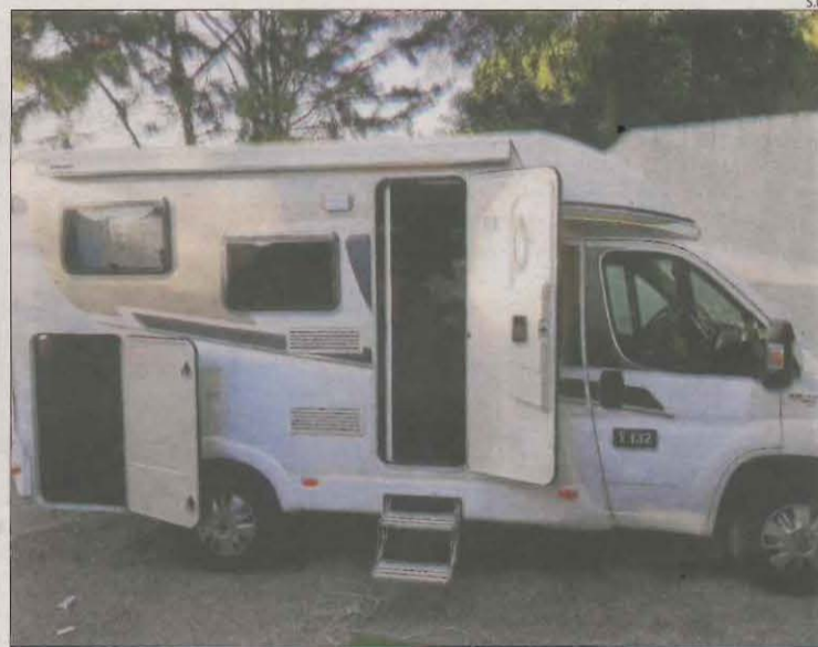
Imatge de l'autocaravana.

La van sostreure dividres a Sitges i la van trobar ahir a Cubelles tot i que sense part del material que hi havia