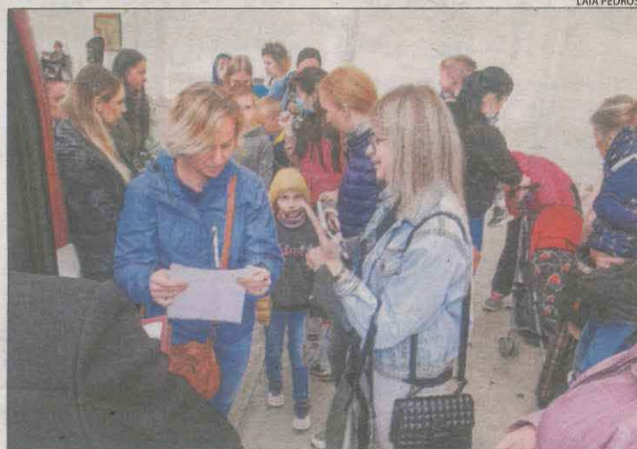
Un dels autobusos per al trasllat de refugiats a Lleida.