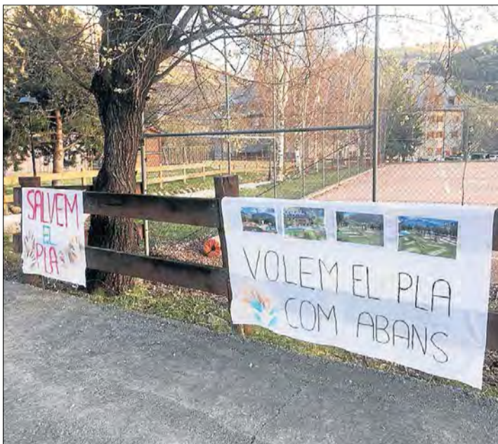
Pancartes dies enrere a la zona d'esbarjo del Pla de l'Ermita.

LLEIDA | L'electricitat que Boí Taüll necessita per funcionar és objecte d'una pugna que ha arribat als tribunals. Actius de Muntanya, empresa pública de la Generalitat propietària de les pistes d'esquí, ha presentat una demanda al jutjat de Tremp per reclamar el dret de pas pels terrenys que travessa l'única línia que subministra l'estació. Són propietat de l'empresa Gestora Valenciana de Viajes en Grupo SL, que