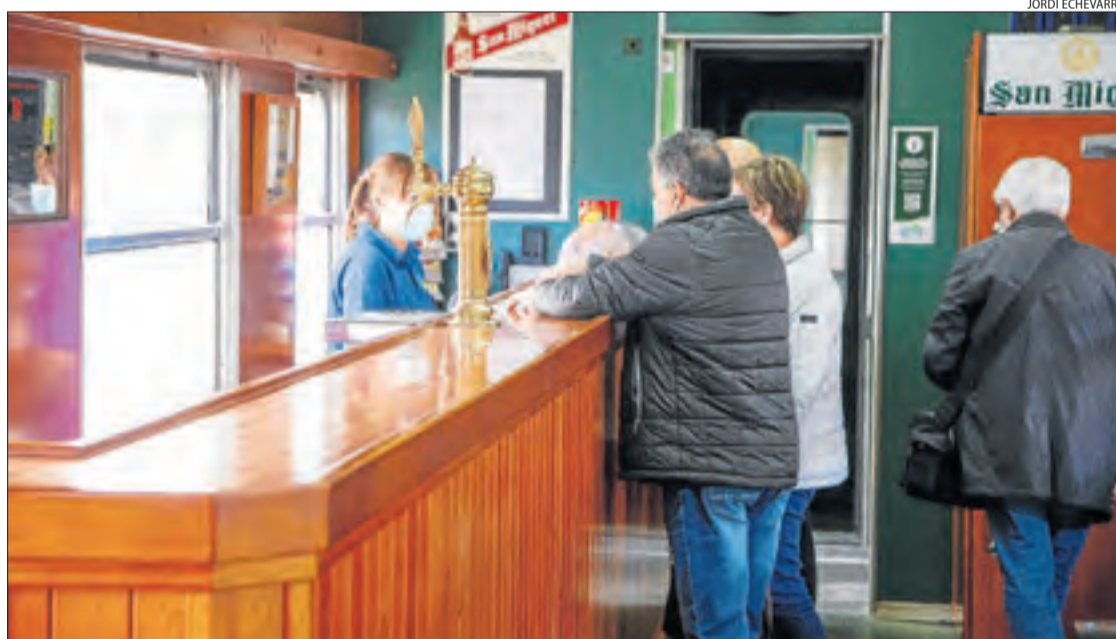
El bar del Tren dels Llacs està operatiu durant el viatge.