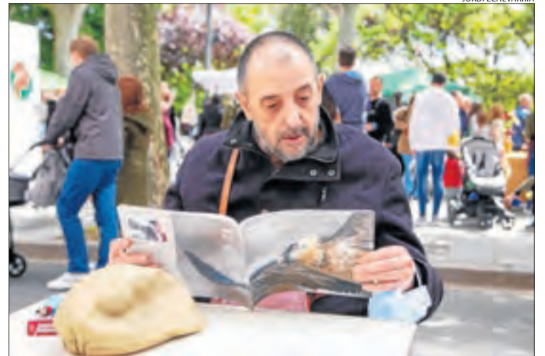
Sant Martí de Maldà. Acte d'Una vida de ferro fos'.