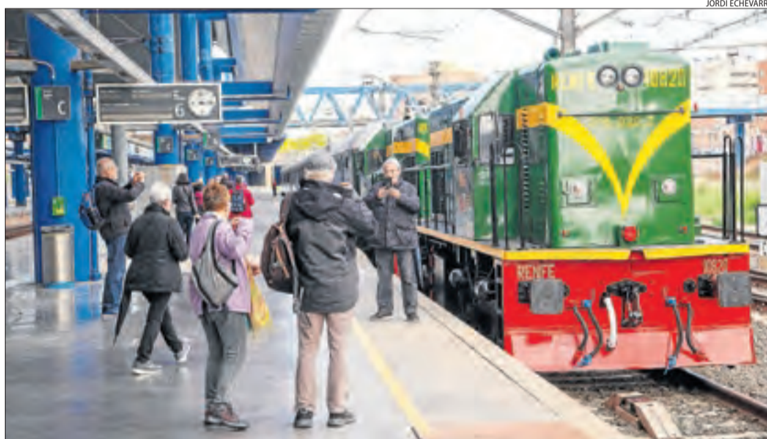
Els passatgers fotografiant-se amb el tren abans de pujar als vagons.