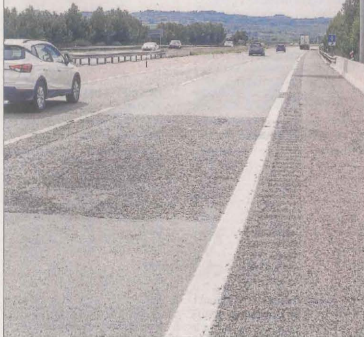
ÉS NOTÍCIA | 3