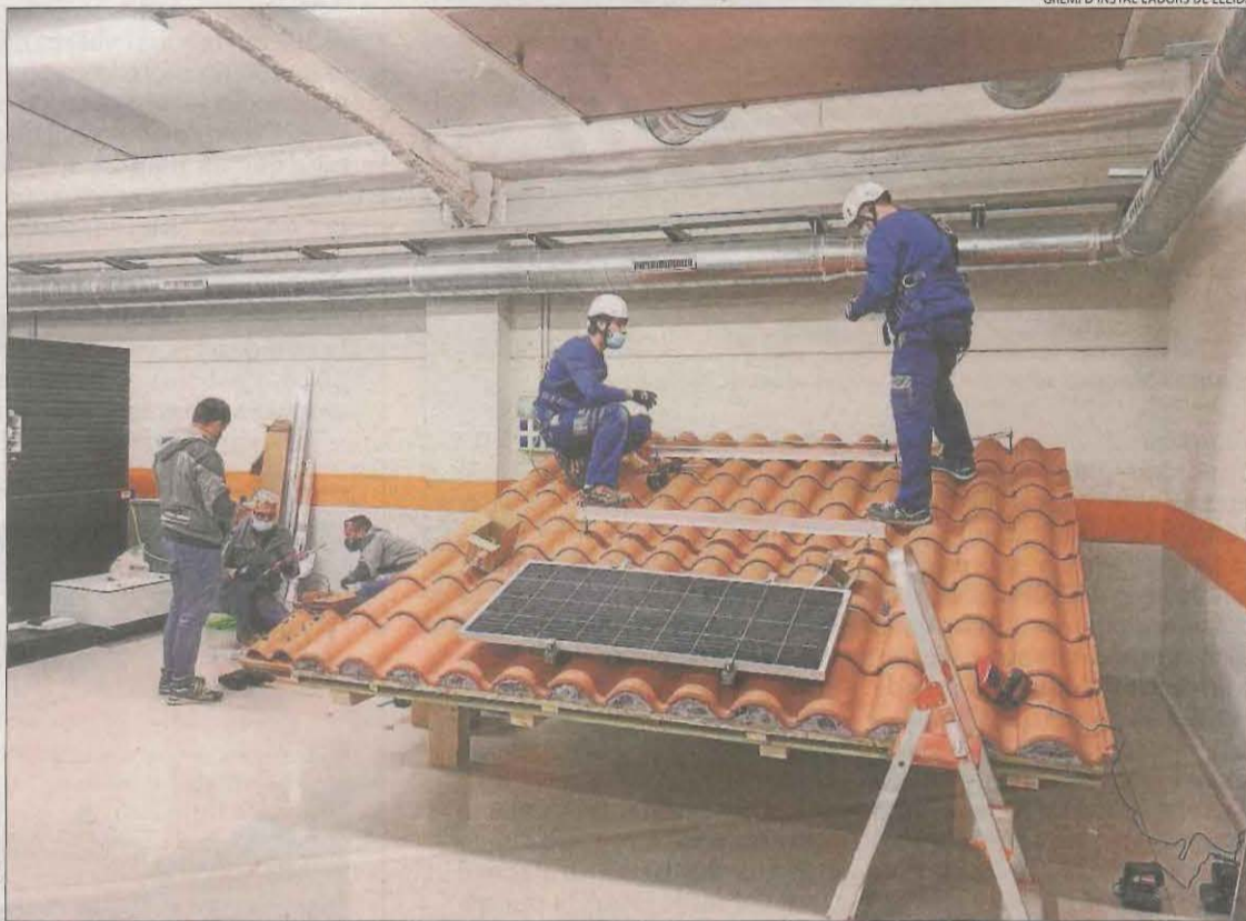
Reproducció d'una teulada que el Gremi d'Instal·ladors usa per a pràctiques d'instal·lació de plafons.

El departament d'Acció Climàtica ha fet els primers passos per reforçar la seua plantilla lleidatana i desencallar els tràmits. Ha iniciat el procés per contrac-