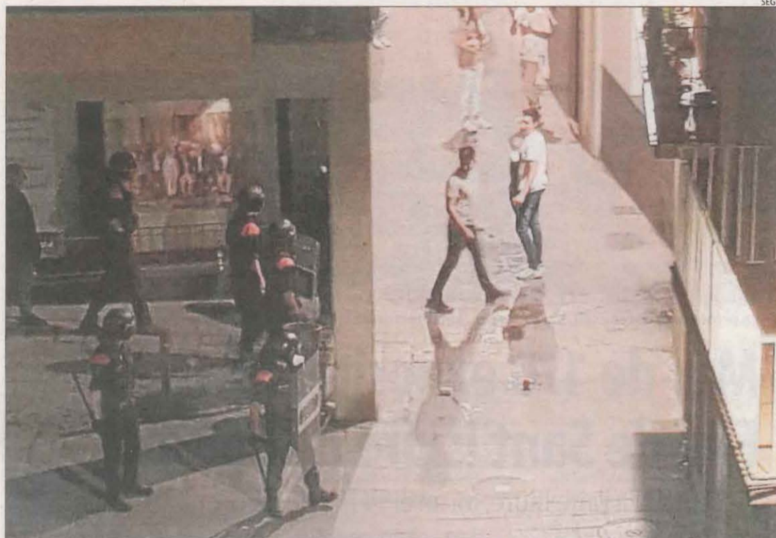
Antiavalots dels Mossos durant el desallotjament del botelló a la Seu l'agost de l'any passat.