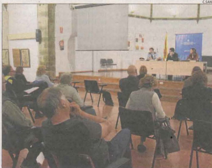
La jornada es va desenvolupar ahir a la sala Sant Domènec de la Seu.

valoració i intervenció de possibles situacions de risc. Fruit d'aquest treball s'elaborarà una guia que s'estendrà a la resta de centres de salut catalans.