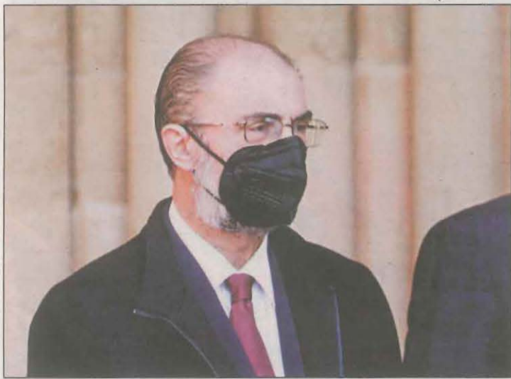
Foto d'arxiu del president d'Aragó, Javier Lambán