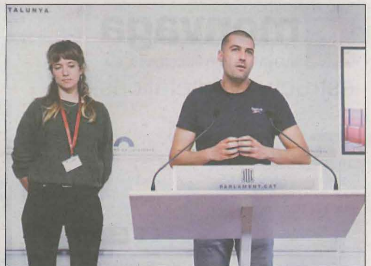
Membres de Stop JJOO van comparèixer ahir