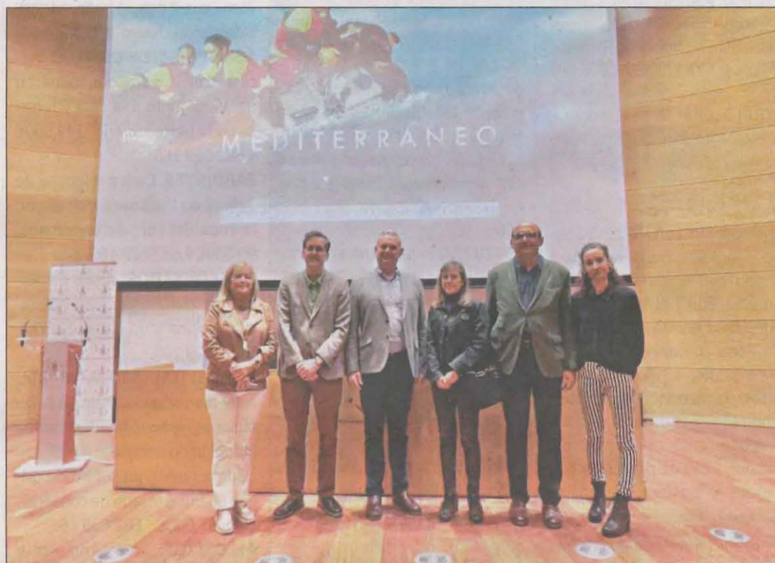
Presentació al campus de Cappont del cicle amb alguns dels ponents d'ahir