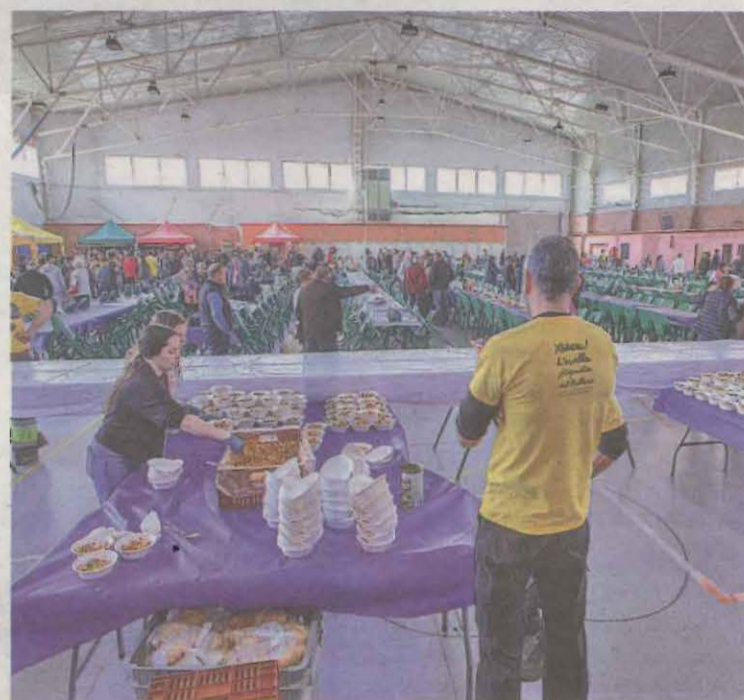
El dinar popular tindrà lloc diumenge

programa Al teu gust, aliments del Pallars desenvolupa un projecte de preservació, revalorització i dinamització d'aquest sector i d'altres vinculats a corder (la carnisseria i la restauració).