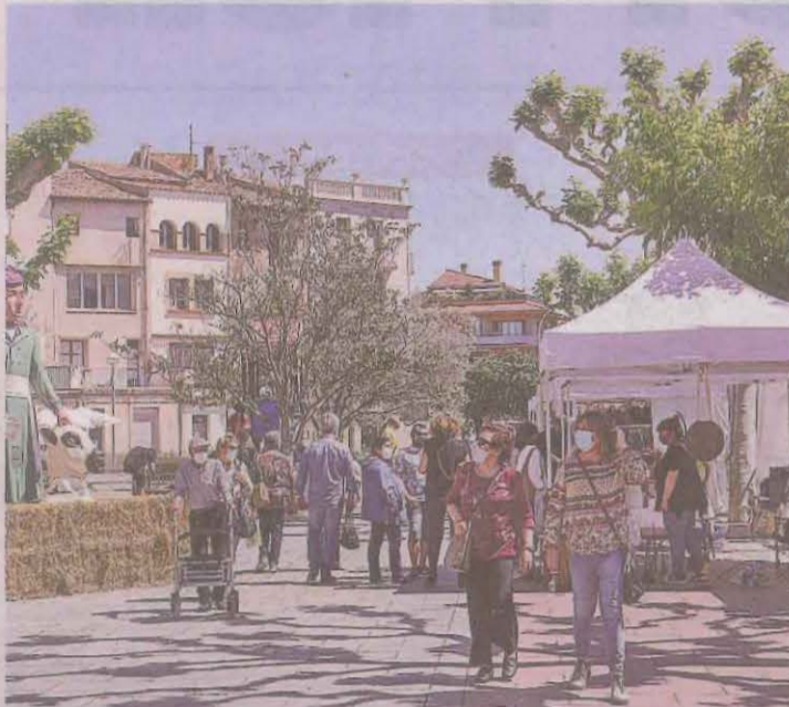
La capital del Jussà promociona la carn de corder

amb Esperanceta. Trencant amb els micromasclismes. A la rambla de Dr. Pearson