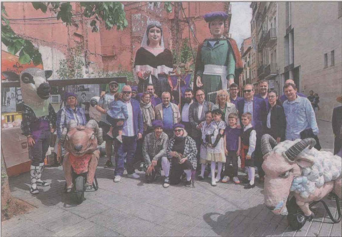
El certamen se celebra aquest cap de setmana i clourà avui amb diverses activitats