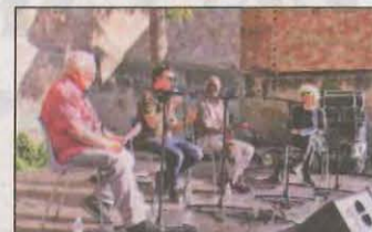
Presentació del programa pilot