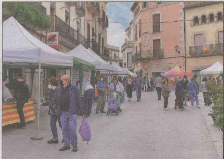
Es van sortejar 200 euros en vals entre els compradors

L'Agrupació de Comerciants de les Borges va celebrar ahir la 37a edició del Mercat de la Ganga, una jornada d'ofertes i descomptes en la qual els i les comerciants del municipi munten parades al voltant de la plaça 1 d'Octubre i de les seves botigues, i sortegen 200 euros en vals entre totes les persones que comprin en algun dels 45 establiments.