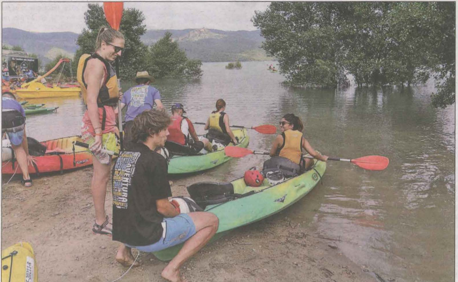
Imatge d'arxiu d'unes persones fent activitats aquàtiques a l'embassament de Canelles

Tot i que les previsions són bones, Joel Mirón explica que també s'ha de tenir en compte el nivell de l'aigua, ja que enguany la falta