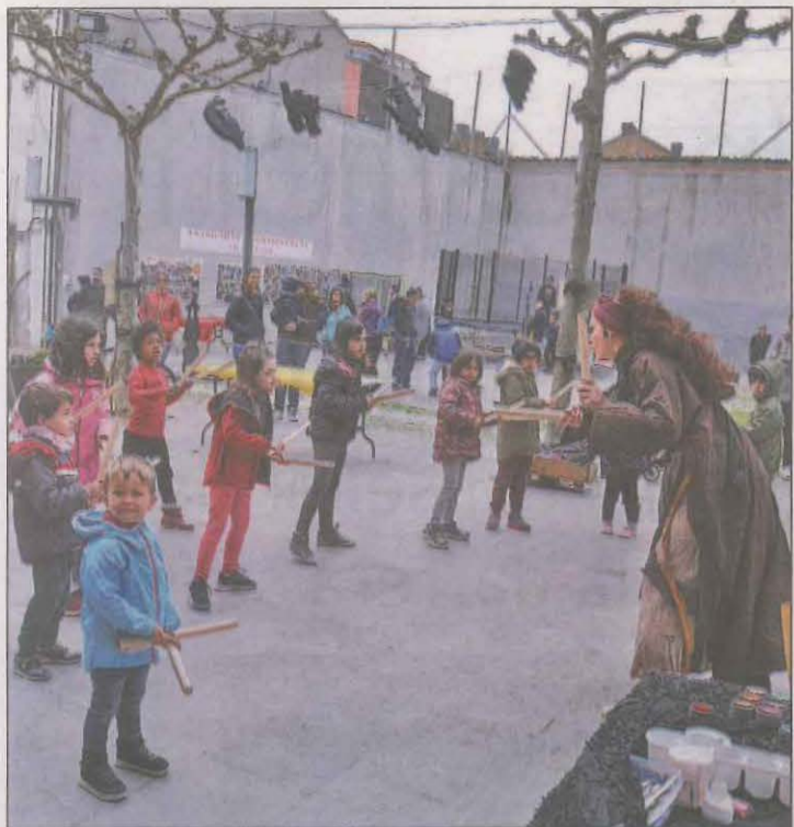
Els actes es van fer a la plaça de Sant Climent