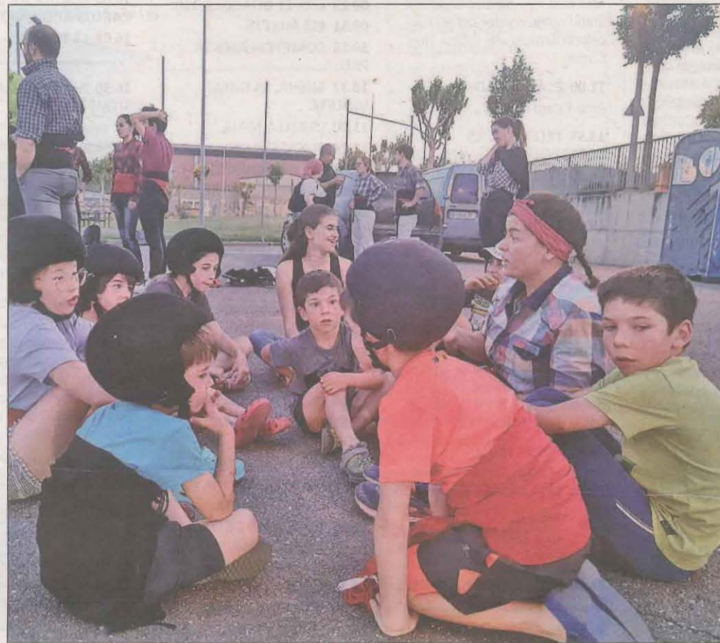
La canalla de la colla rebent instruccions d'una castellera. A la dreta, un dels enxanetes en un assaig

Capó reconeix la dificultat als Pallars per reunir gent, que explica per una demografia baixa i la nul·la tradició castellera. Amb tot, la colla reprèn amb il·lusió els as-