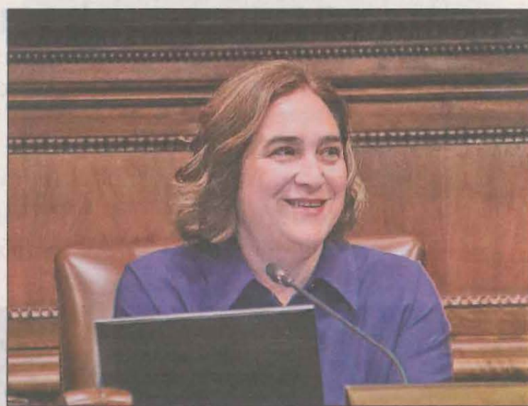
L’alcaldessa de Barcelona, Ada Colau

Sobre una possible consulta a Barcelona, Colau també va remarcar que de moment no existeix un projecte sobre el que es puguin pronunciar.