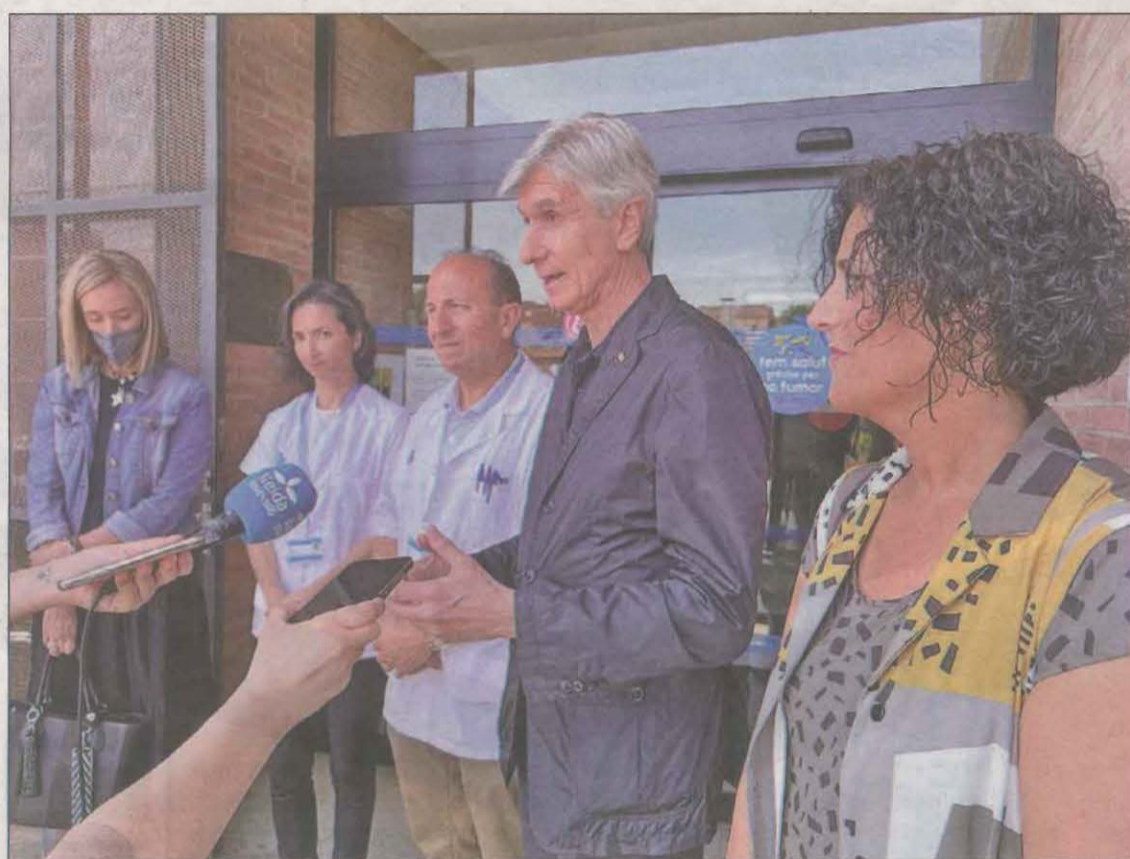
El conseller Argimon atén els mitjans durant una visita al CAP d’Almacelles

Des del Col·legi de Metges consideren que cal fer una major campanya de difusió de les places vacants i consideren que el clima sociopolític “no ajuda” a atraure talent d’altres comunitats. El De-