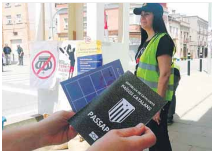
Passaports que es regalaven a conductors i vianants

La implicació de l'Ajuntament en les jornades es va limitar a la cessió de la pista esportiva per poder fer els concerts i les xerrades, i, tot i que l'administració s'ha mantingut al