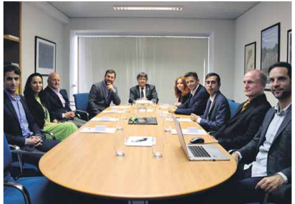
Carles Puigdemont i Toni Comín, en una reunió amb els primers delegats exteriors

El desplegament de la representació exterior del Consell per la República ha començat principalment al continent europeu i els Estats Units, indrets considerats “estra-