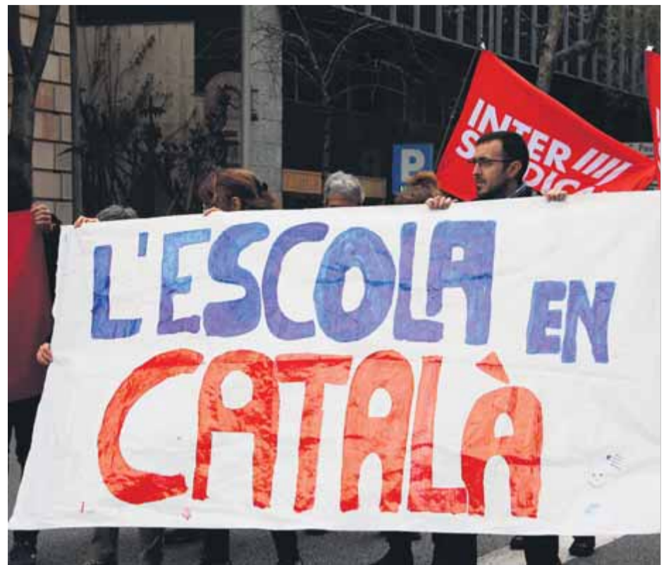
Una pancarta durant una manifestació al març contra la sentència del 25%

Les negociacions poden continuar els pròxims dies perquè de moment encara no s'ha registrat la petició de junta de portaveus extraordinària per incloure la reforma de la llei en l'ordre del dia del ple de la setmana que ve, malgrat haver passat un dia del termini que ERC, el PSC i els comuns van donar a Junts per tornar a l'acord inicial. De fet el president de la Generalitat, Pere Aragonès, va insistir ahir des de Brussel·les a "continuar treballant fins al final" per tancar un acord sobre la nova llei per preservar el català a les aules davant la sentència del TSJC per imposar un mínim del 25% de castellà a les escoles. ■