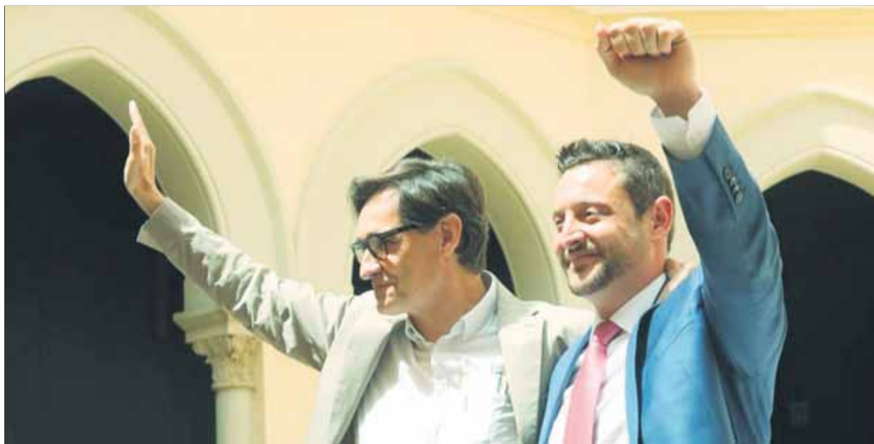
El primer secretari del PSC, Salvador Illa, amb el candidat a Tarragona, Rubén Viñuales, dissabte

“Més llistes, més riques i més competitives”, amb l'objectiu de consolidar la recuperació que van començar a experimentar el 2019 al cinturó metropolità, però sobretot per tenir més presència a l'interior del país. El principal repte, deixant de banda el de la capital catalana, on tot fa pensar que repetirà Jaume Collboni de candidat, se centrarà també en tres municipis clau i significatius que van perdre en els darrers comicis: Tarragona, Lleida i Terrassa, però també Reus, on van tenir l'alcaldia des del 1979 fins al 2011. Així ho resumia el secretari de Política Municipal, Joaquín Fernández, per explicar els principals eixos en els quals la formació, conjuntament amb l'àrea d'Organització i Acció Electoral, que coor-