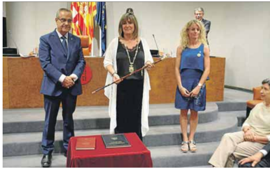
La socialista Núria Marín en el moment de prendre possessió a la Diputació de Barcelona

L'alcalde de Salàs de Pallars, Francesc Borrell i Grau, va morir el novembre del 2021. Era batlle de la població del Pallars Jussà des del 2003 (CxS). Borrell era un dels polítics pirinencs amb més trajectòria municipal i havia estat regidor a l'Ajuntament des del 1991. ■