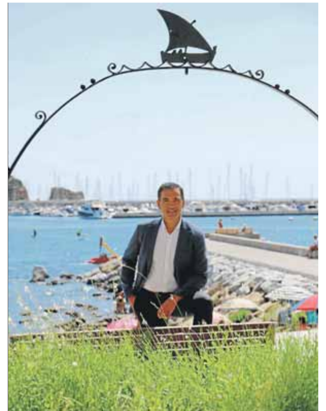
Carles Motas és l'alcalde de Sant Feliu de Guíxols i diputat a la Diputació de Girona pels independents Tots per l'Empordà ■ E. AGULLÓ