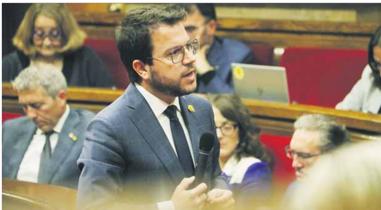
El president de la Generalitat, Pere Aragonès, s'adreça al ple del Parlament, ahir al matí