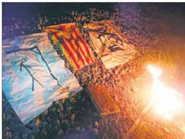
Imatges penjades al compte de Twitter d'Acció per la Independència ■ EL PUNT AVUI

Acció per la Independència ha reivindicat el sabotatge a les vies del TAV que va tenir lloc diumenge entre Vilobí d'Onyar i Figueres, i que va provocar nombrosos retards als trens de la línia Barcelona-Figueres. Els autors del sabotatge van cremar arquetes de cablejat al tram d'Aiguaviva al voltant de la matina i el centre de control d'Adif en va informar cap a