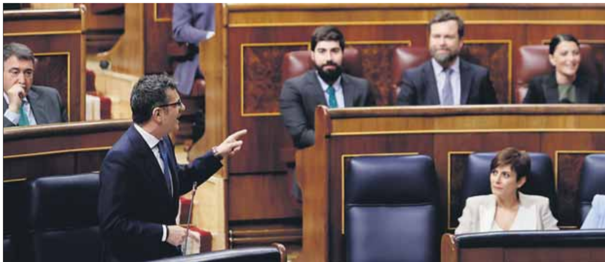
Bolaños rebut, ahir, el que havia dit Olona (Vox), amb la samarreta del Piuet enfadat en el comiat al Congrés

El ple monogràfic d'avui va viure un aperitiu ahir a la sessió de control