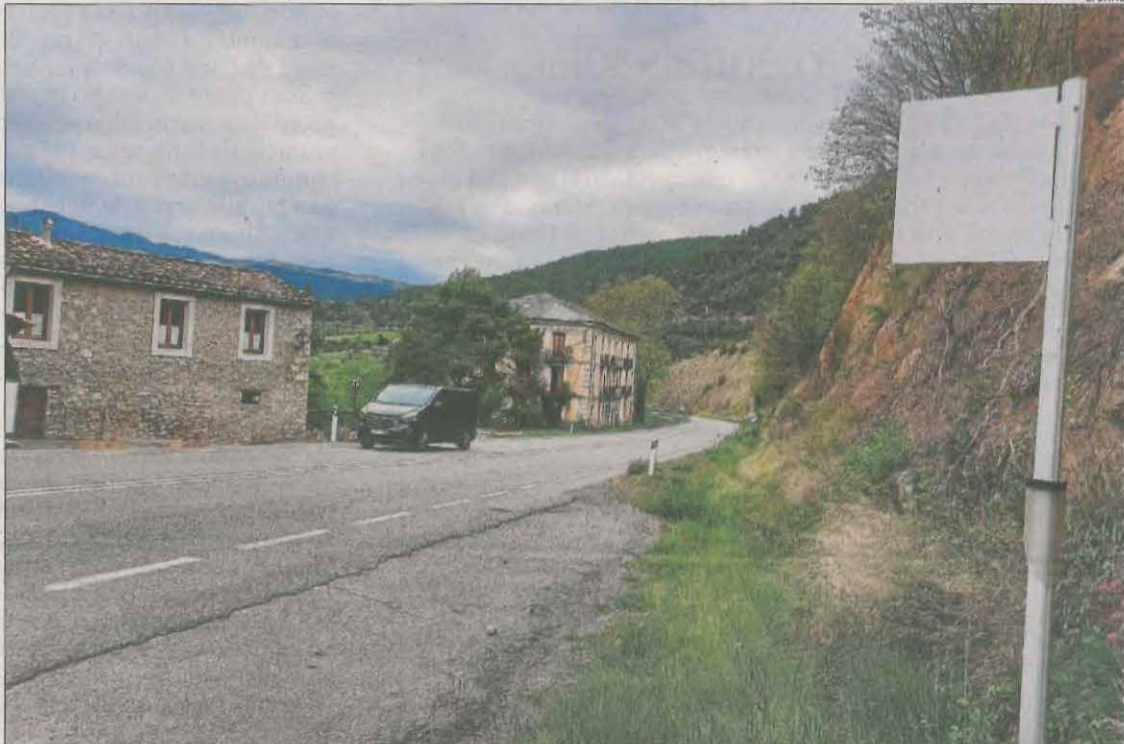
Una parada de bus en què la senyalització s'ha deteriorat fins a quedar esborrada al Pont de Bar.

■ La Generalitat va obrir el túnel al trànsit al considerar-ho segur, però tem que els corrents d'aire afectin els camions si circulen per sobre dels 60 quilòmetres per hora actuals.