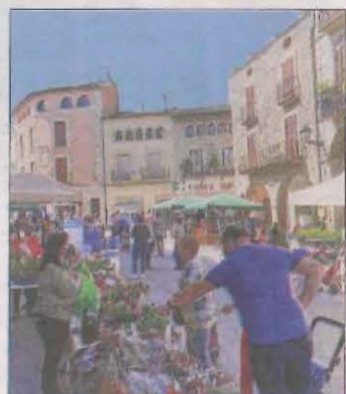
Se celebrarà dissabte al matí.

Com de costum, els comerciants locals muntaran parades al voltant de la plaça 1 d'octubre i davant les seues botigues, on posaran a la venda articles a preus força rebaixats. A banda de gaudir de les ofertes, el públic podrà gaudir de la música, inflables o ser agraiat amb un dels 4 vals per valor de 50 euros sortejats.