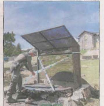
Barbacoa a la Cerdanya.