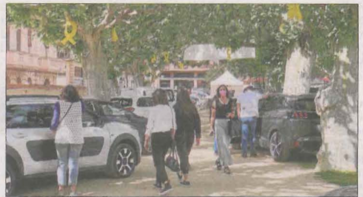
El president del RACC inaugurarà avui a les sis el certamen.