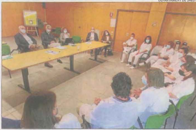
Argimon es va reunir amb personal sanitari del Pallars.