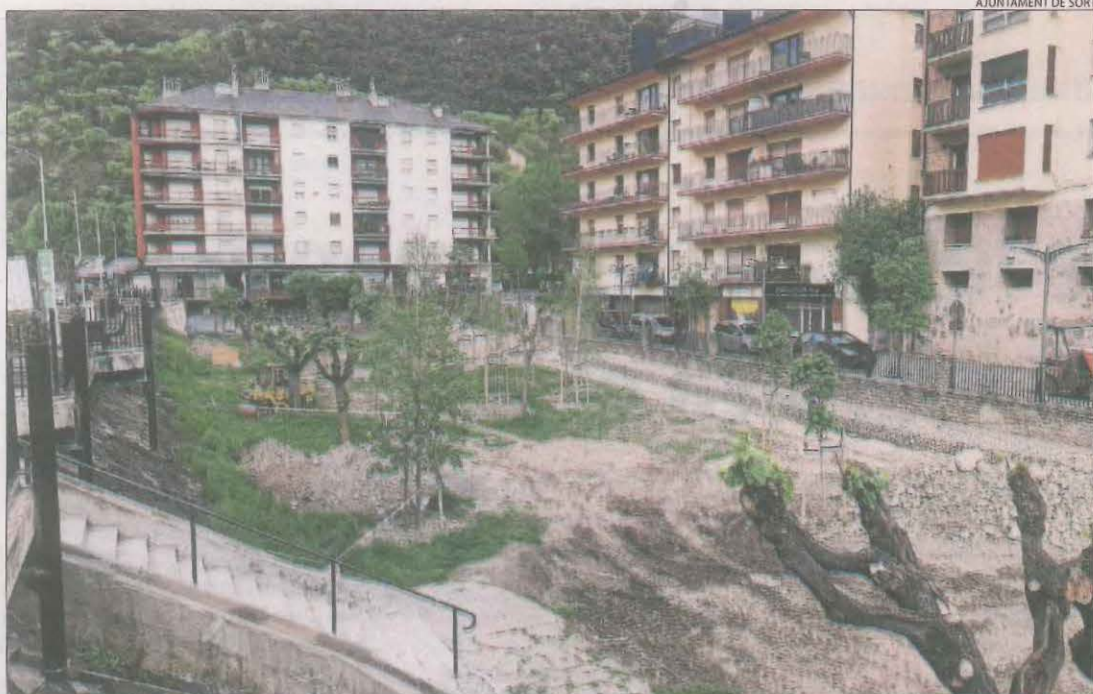
L'estat en què han quedat els arbres del nou parc del Riuet de Sort.