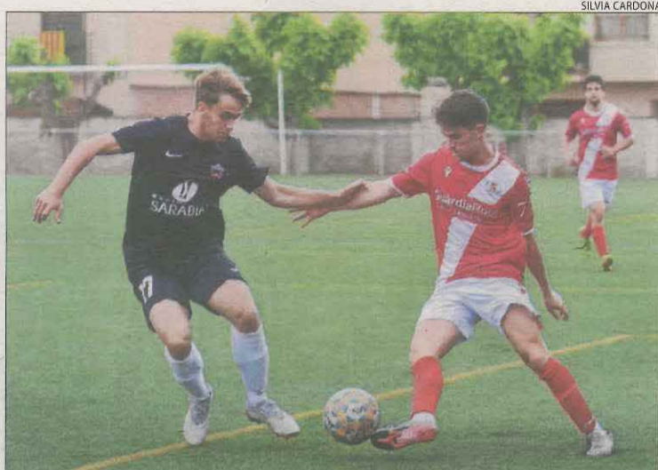
Un jugador de l'Artesa de Segre intenta superar Requena.