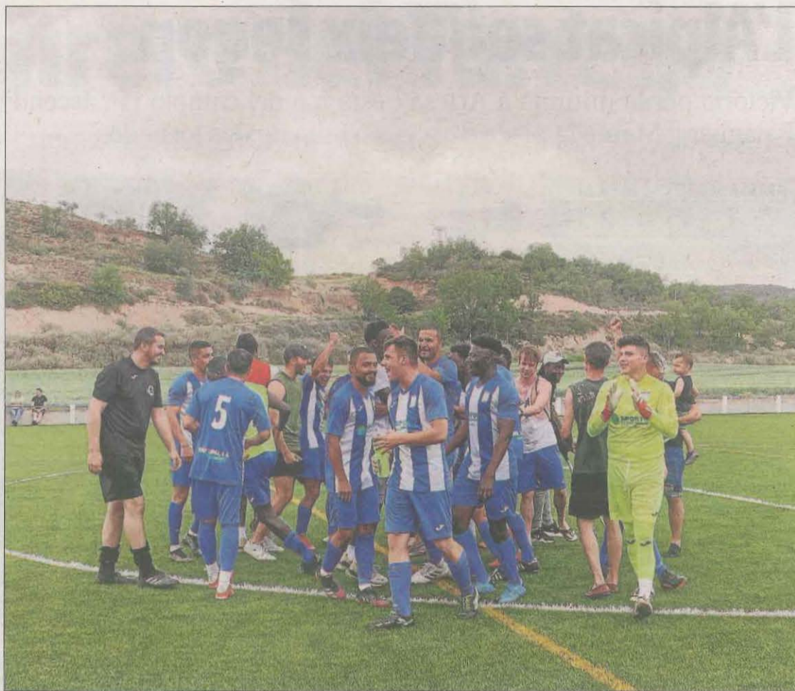
Els jugadors del Vilanova de l'Aguda celebren la salvació després del partit.

JOSEP CAPELL | VILANOVA DE L'AGUDA | Plàcid partit del Vilanova de l'Aguda per confirmar de forma matemàtica la salvació. L'encontre va ser dominat per l'equip local, que tenia al davant un conjunt sense res en joc. Els locals es van avançar en el marcador als 18 minuts de joc, gràcies a un gol de Moustapha amb una bona jugada. El Vilanova va continuar insistint durant tot el duel, creant nombroses ocasions, però no va tenir encert de cara a porta. En els últims instants del matx, els locals van poder anotar dos gols més, un de penal i un altre de Baba, a l'última jugada, que van sentenciar el partit i van donar els tres punts als locals.