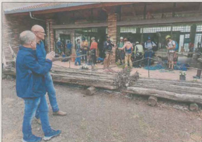
Romeva, durant la visita al centre del Pallars Jussà.