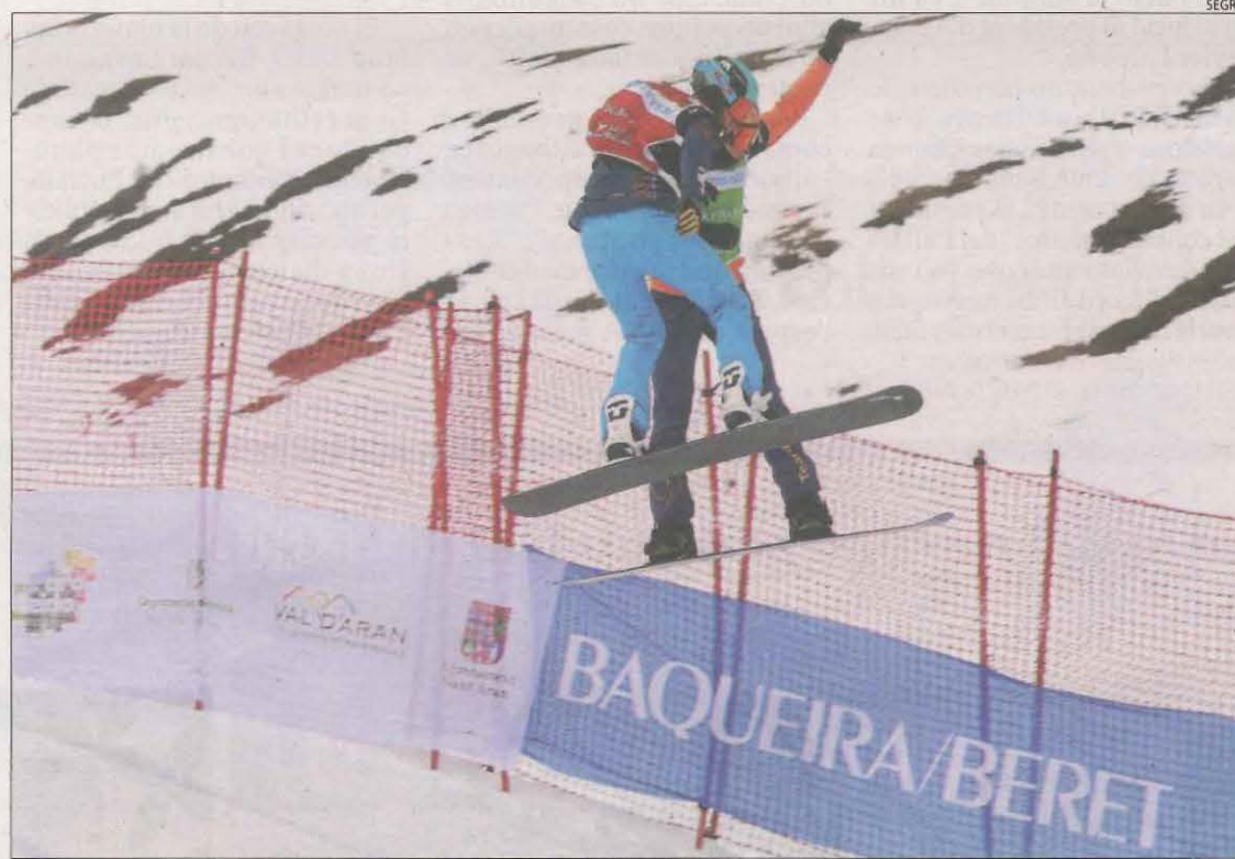
Una prova de la Copa del Món de snowboard celebrada a Baqueira Beret.