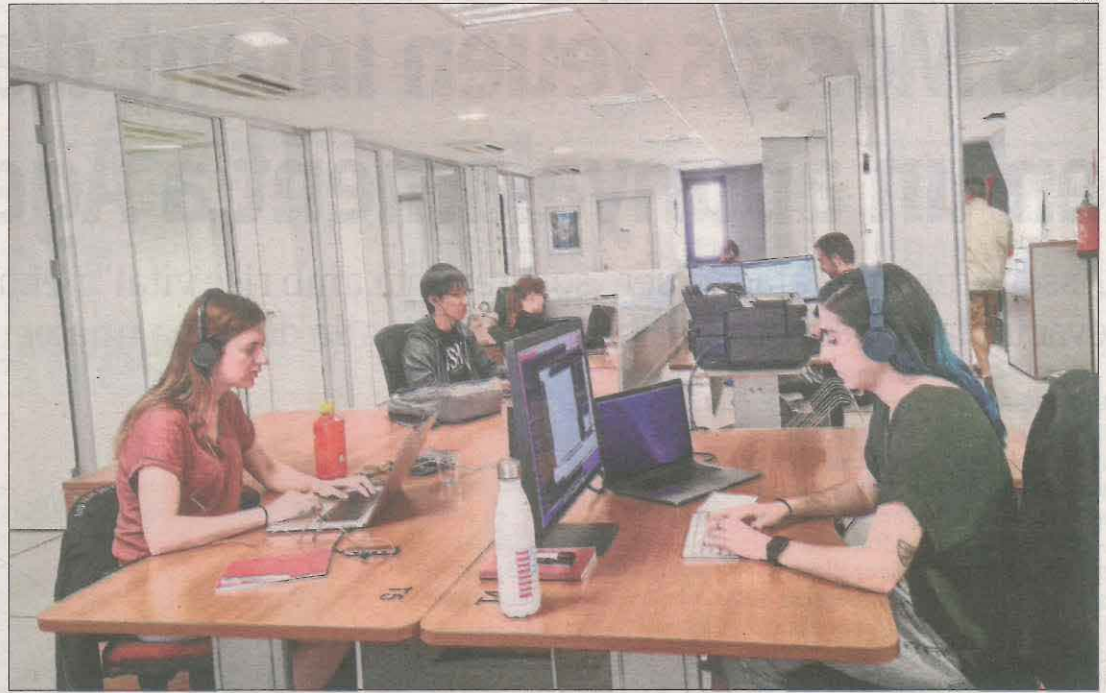
Professionals amb perfils digitals procedents d'entorns urbans teletreballant des de Tremp.