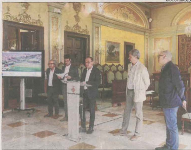
La presentació del projecte de restauració.