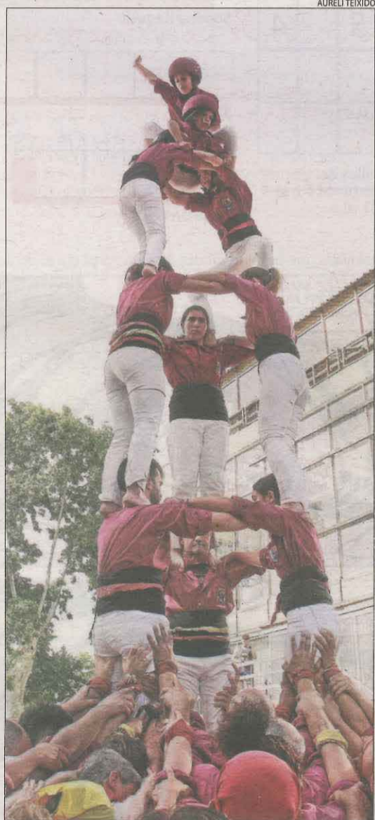
Castell 3 de 6.