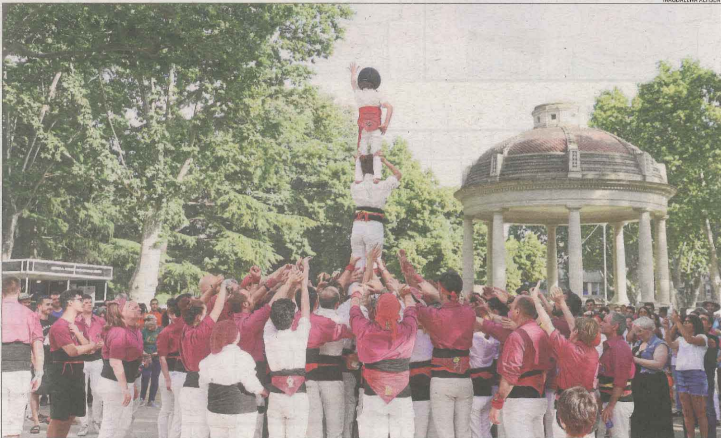
Un pilar de 3, descarregat per part dels Malfargats, va obrir l'actuació casteller a l'Aplec.

nous castellers al tronc. Aquest 3 de 6 es descarregà amb seguretat i sense gaires problemes amb molta tranquil·litat i ferm, sense moviments ni deformar la construcció. Continuant amb la festa els Malfargats enceten un pilar de 4 aixecat per sota. Amb valor, empena i molt d'ordre carreguen amb alguna rebregada puntual. En segona ronda Castellers de Lleida descarreguem un 4 de 6 amb agulla estable en la seva execució i sense complicacions, la canalla demostrà que té controlat aquest castell i demanà tornar al 4 de 7 amb agulla en la pròxima diada casteller. A continuació, Malfargats prova una torre de 5 amb algunes rebregades però que descarrega amb seguretat. Ja en tercera ronda tornem al castell de 4 de 6 lleuger, castell que manté les formes i que es descar-