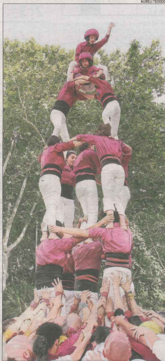
Castell 4 de 6 amb agulla.

rega sense problemes. Ja més tranquils s'ajudà Malfargats a protegir una prova neta de 3 de 5 recolzant posicions en què manquen persones i demostrant un cop més l'agermanament i la col·laboració entre colles de ponent per tal d'ajudar i formar aquesta colla jove. Pocs minuts abans de tancar l'actuació als Camps Elisis, les dues colles descarreguen dos pilars de 4 simultanis i seguidament una pinya d'agermanament per permetre posar el seu anterior 3 de 5 net a sobre de pinya per fer la prova del 3 de 6. Aquesta pinya amb la colla dels Malfargats permet una col·laboració propera i un assessorament per tal de formar els del Pallars i ajudar a poder gaudir-los en pròximes diades amb castells més tecnificats.