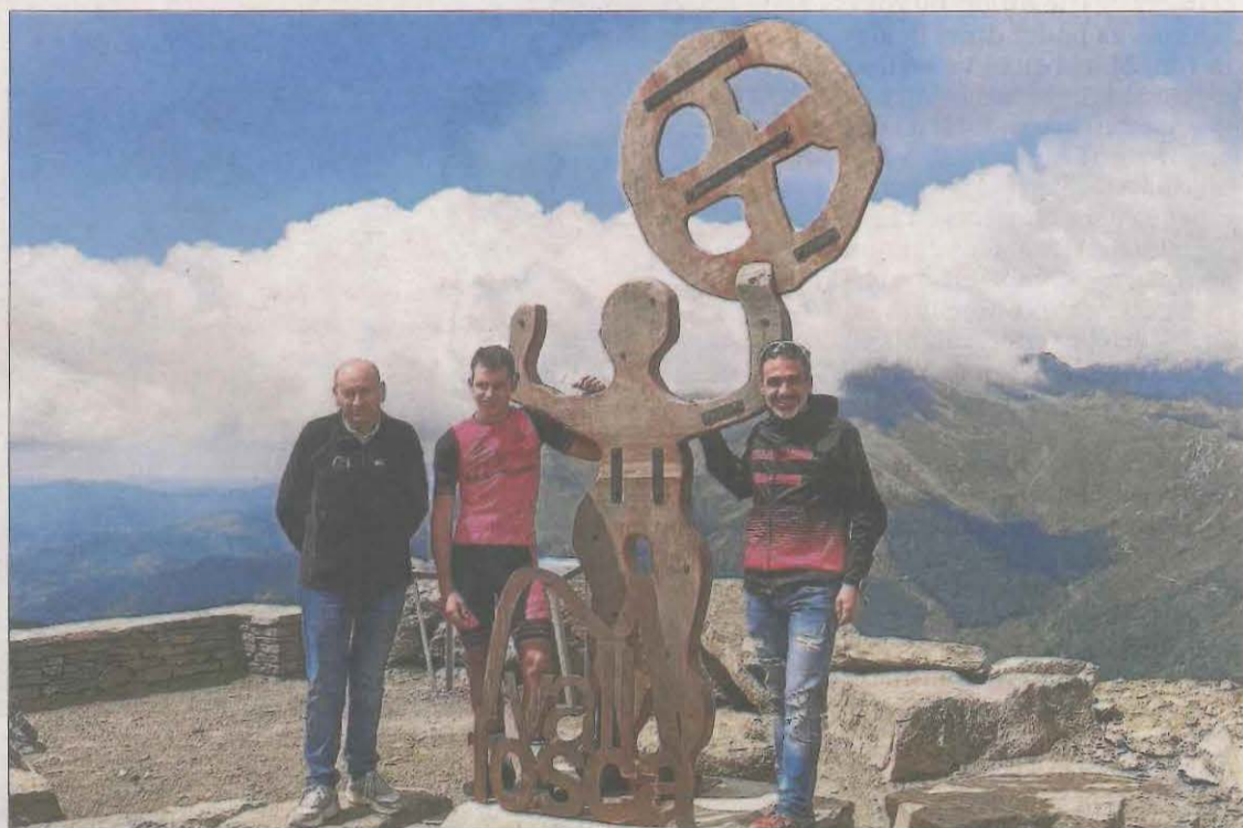
La inauguració de l'estàtua del Gegant del Triador va tenir lloc l'any passat.

El Vall Fosca Outdoor Festival està pensat com una experiència completa, ja que no només consisteix a córrer les diferents etapes de les diferents