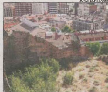
Tram amb murs deteriorats.

vegetals adaptades al clima, illes de biodiversitat perquè es puguin desenvolupar diferents espècies vegetals i camins perimetrals. Va apuntar que també han presentat un altre projecte, del qual encara no s'ha emès la resolució, per crear un màping a la Porta dels Apòstols, disposar d'equips de realitat virtual i augmentada per als visitants, més il·luminació i càmeres de seguretat i un sistema de monitoratge de les muralles per detectar possibles problemes i poder efectuar d'aquesta manera un manteniment preventiu.