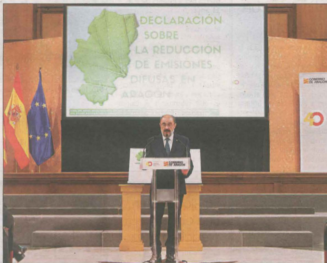
Imatge del president d'Aragó, Javier Lambán, en un acte a Saragossa