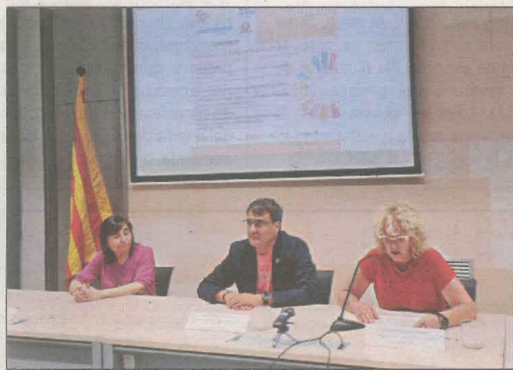
L'estudi va ser encarregat pel Geoparc Orígens

Un estudi aconsella evitar l'efecte acumulatiu de parcs solars a la Conca de Tremp