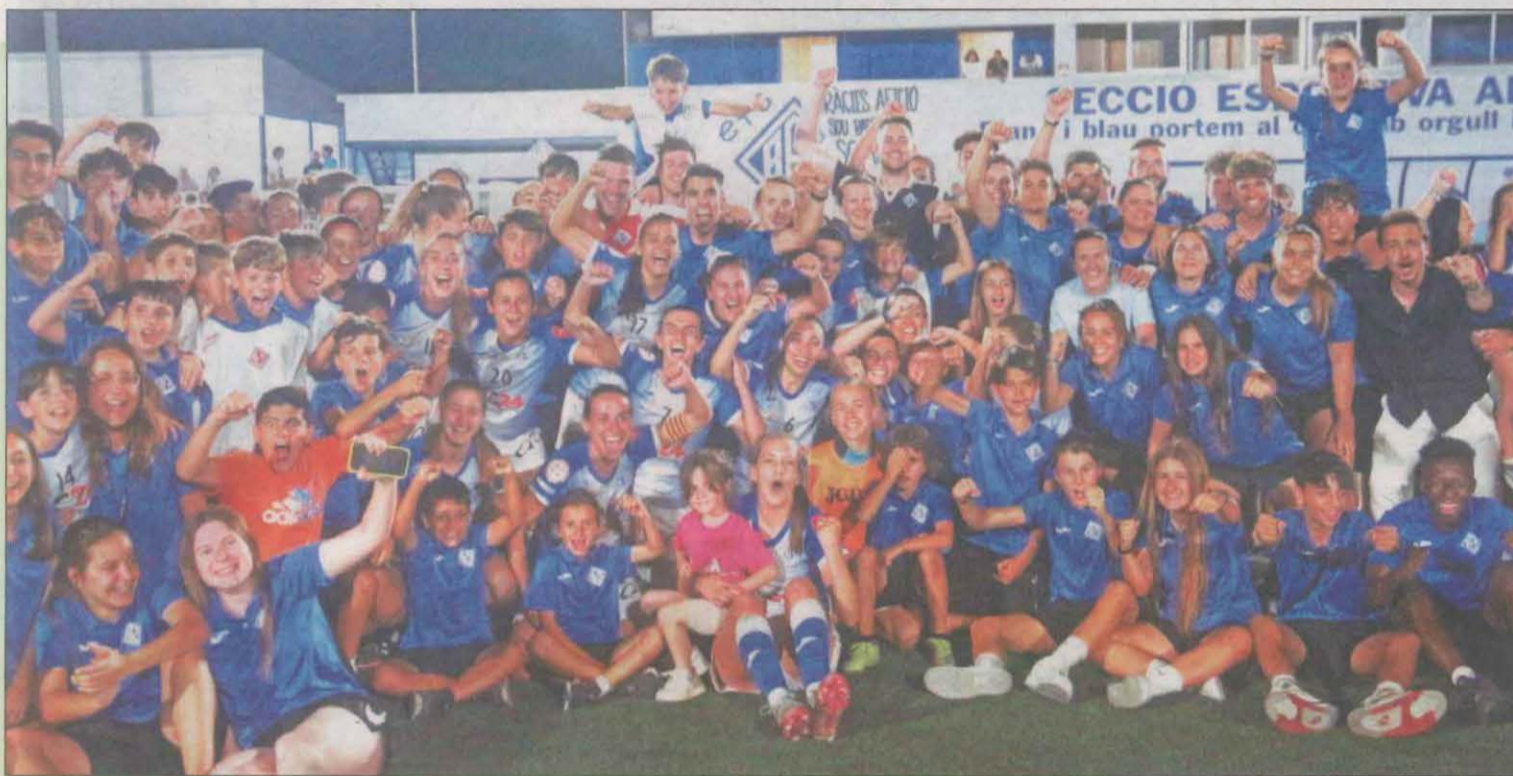
La plantilla y los aficionados expresaron su alegría a la conclusión del encuentro

▶ Lambán propone dividir la candidatura por "lotes" y que elija primero el Principat | PÁG. 13