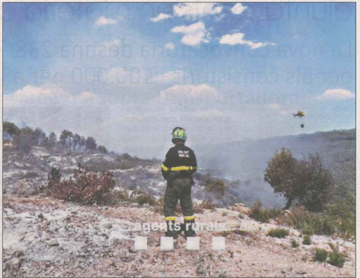
Un Agent Rural observant l'helicòpter dels Bombers a la Serra de la Llena

al terme d'Ulldemolins i una part a Juncosa. Treballen amb la hipòtesi d'una crema de restes vegetals com a possible causa. D'altra banda, els Bombers van apagar un altre incendi al mont de les Conques, a Isona i Conca Dellà (Pallars Jussà). El cos va rebre l'avís a les 11.58 hores i van activar 14 dotacions, 12 terrestres i 2 mitjans aeris. L'afectació va ser de marges i illetes forestals.