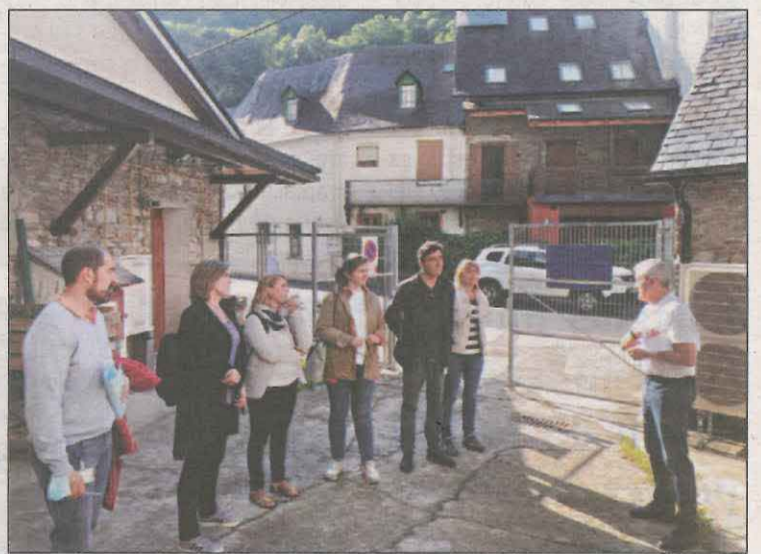
La visita que va fer ahir dimarts la síndica