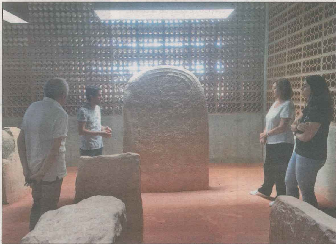
El grup escultòric de Seró és el més rellevant del neolític final a Catalunya

Al matí es farà la pròpia fira, per conèixer, participar i gaudir de diferents activitats i tallers que proposaran més d'una quinzena d'expositors procedents de Catalunya. Aquesta comptarà amb la participació de les colles de gegants de Moià i de l'Espluga de Francolí, i una colla d'animació de Viladecans. A la tarda, la fira tindrà un perfil més tècnic i crearà un espai en què els professionals de la didàctica podran compartir experiències i valorar reptes de present i futur, a més de decidir la data i la seu de la propera trobada. Prehistoscopi és una iniciativa del Camp d'Aprenentatge de la Noguera, el Museu de Suport