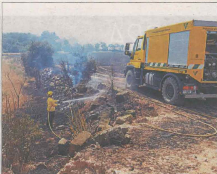
Un incendi originat per la recol·lecció del cereal

L'ordre també recorda que tota la maquinària agrícola s'ha de mantenir en les condicions adequades i fer revisions periòdiques