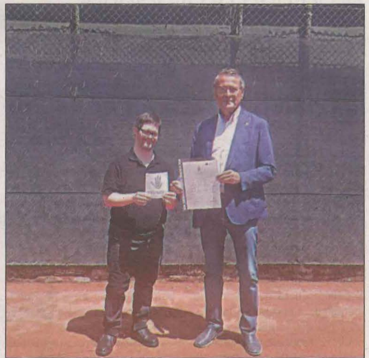
La Unión Europea impulsa el proyecto 'Valueable'

El Club Tennis Lleida ha sido reconocido estos días con el nivel Plata Valueable, un galardón concedido por el Comité Internacional del proyecto valueablennetwork , que está impulsado por la Unión Europea, por la aportación del club leridano en la inclusión laboral de las personas con discapacidad y también por aplicar la igualdad de oportunidades en este ámbito. Actualmente, el proyecto cuenta con más de 100 miembros de casi todos los países europeos