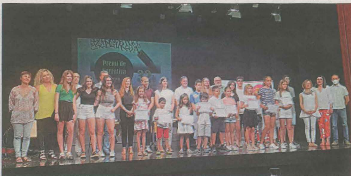
Imatge de grup de tots els premiats en l'edició d'enguany