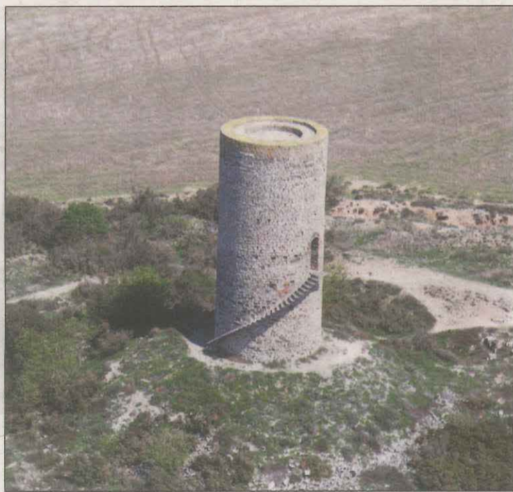
Imatge del Pilar d'Almenara, a Agramunt