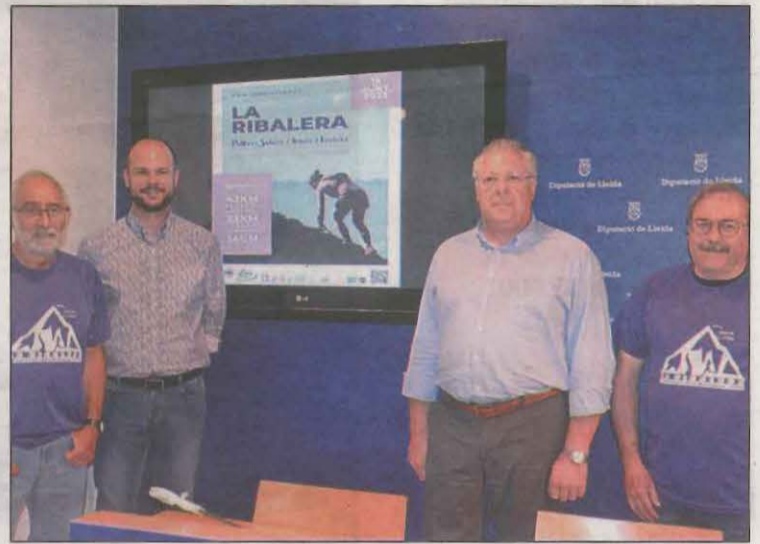
La prueba cuenta con 120 voluntarios