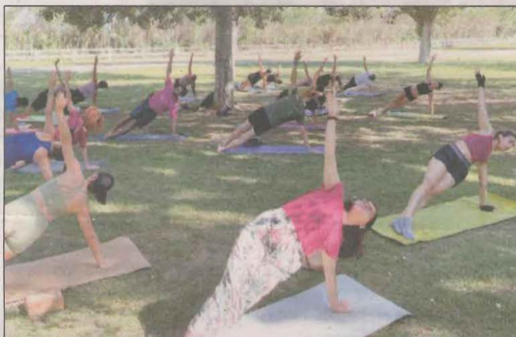
La sessió de ioga a la natura va reunir ahir 24 persones

La Festa del Medi Ambient va omplir d'activitats el parc de la Mitjana aquest dissabte al matí. Una sessió de ioga a la natura, en la qual van participar 24 persones a l'ombra dels àlbers, va ser el tren de sortida d'una programació que va comptar amb propostes durant tota la jornada.