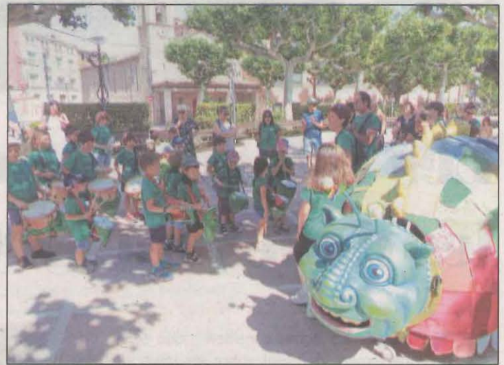
Els nens dels Targalets i Targalots, en els actes inaugurals

ra, tot remarquant que el poble està convertint "un producte propi com és el vi elaborat a alçada" en un element diferencial i singular que li ha de servir de "palanca per transformar el seu sistema econòmic".