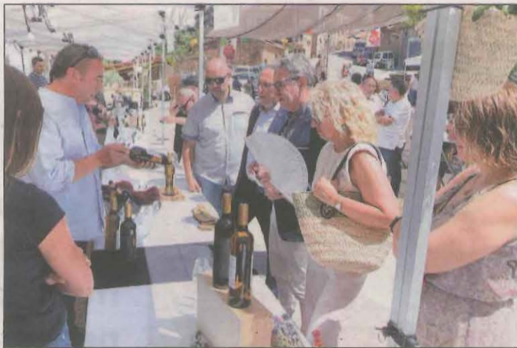
Visita de Talarn a la fira del Pallars Jussà

En acabar, s'han desplaçat a la plaça Anna M. Janer, on han efectuat la visita inaugural de la 10a Fira del Vi del Pirineu. També han efectuat una visita a Vivisions, una exposició de l'Associació Fotogràfica del Pallars, i han assistit a l'acte de presentació de la botella de vi commemorativa de