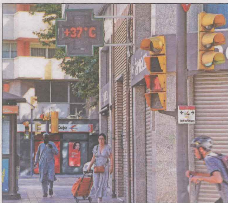
Lleida també va patir ahir l'onada de calor

Protecció Civil de la Generalitat ha demanat als ajuntaments