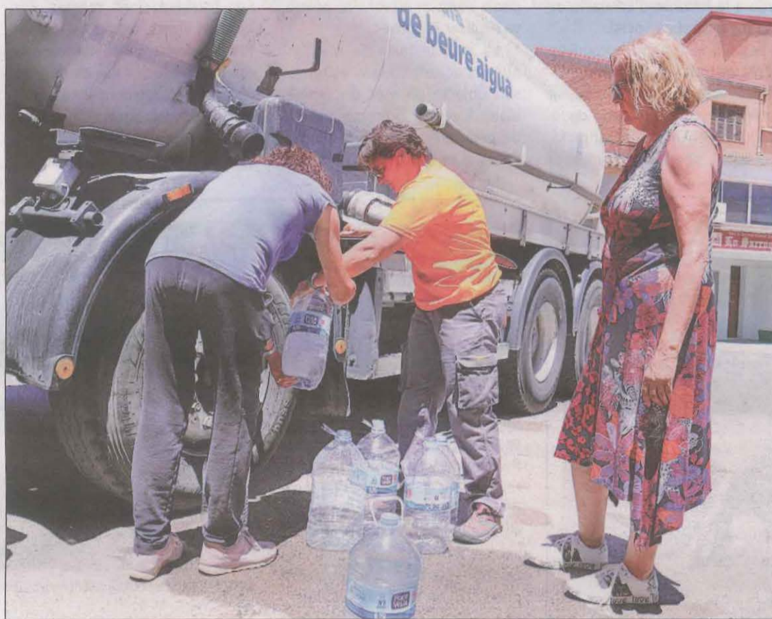
Veïns de Sarroca de Lleida omplen garrafes d'aigua potable del camió cisterna

Des de l'ACA apunten que no es tracta d'una contaminació puntual, sinó que "és clarament una contaminació difosa en l'espai i el temps". Per aquest motiu, l'ACA ha decidit ampliar el rang d'abast i farà mostreigs al tram final de la Noguera Ribagorçana, al Segre aigües amunt de l'aiguabarreig del riu Corb, al riu Corb, al riu Set abans de l'embassament