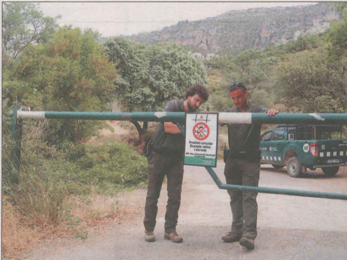
Els Agents Rurals van tancar ahir el massís del Montsec pel risc d'incendi que hi ha actualment

Els Agents Rurals van fer efectiu ahir el tancament dels accessos al Montsec d'Ares, el de Rúbies i a la Baronia de Rialp (com va avançar ahir LA MAÑANA) després de l'activació del pla Alfa 3 per l'elevat risc d'incendi. Espais naturals molt concorreguts com el congost de Mont-Rebei no es podran visitar a peu fins que millorin les condicions climatològiques. A l'alçada de Corça (Noguera) els cotxes han de girar cua i no poden accedir a la Pertusa ja que en aquest punt s'ha tancat la barrera per poder continuar circulant per la pista que condueix fins a l'apar-