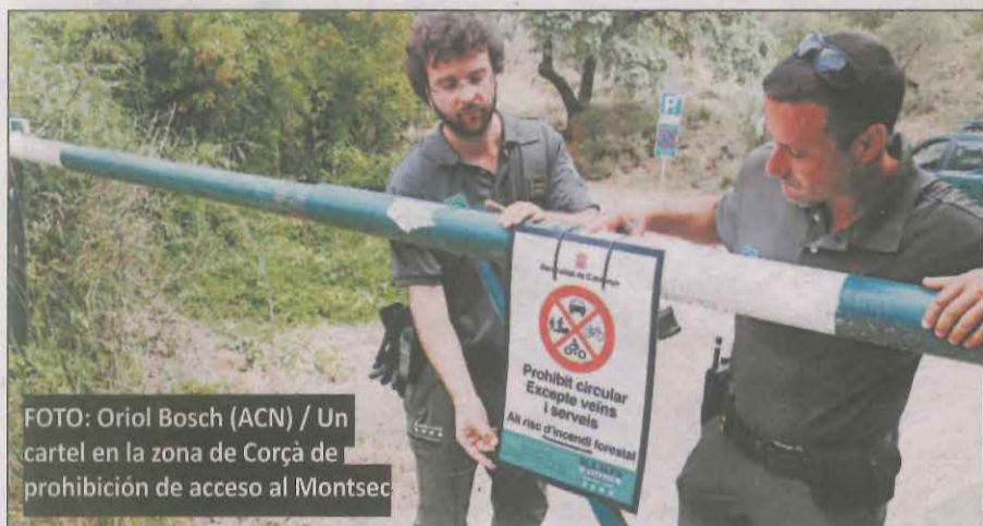
Un cartel en la zona de Corça de prohibición de acceso al Montsec

Un vecino de Baldomar dice a 'La Mañana': "Me dan ganas de llorar"