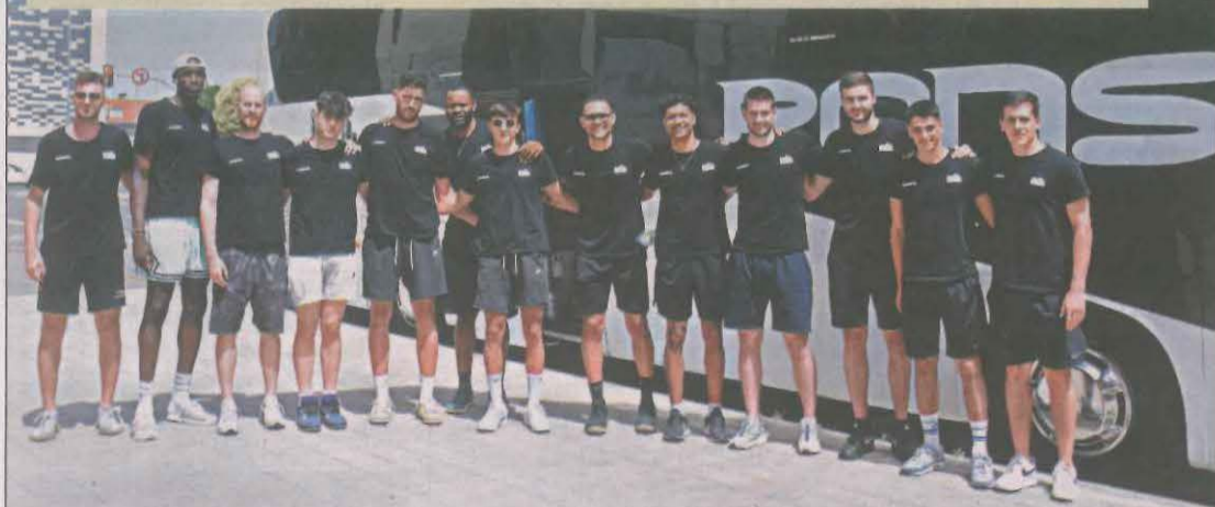
El Força Lleida se mide hoy a los anfitriones en la semifinal por el ascenso | PÁG. 23