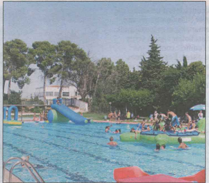
La piscina de les Bordes Blanques

A causa de l'onada de calor, l'escola d'Alfés va notificar a Riscos Laborals que aquesta setmana s'ha arribat a temperatures de 31 graus dins les aules. El professorat va assenyalar que a les nou del matí tenien les finestres obertes i utilitzaven ventiladors amb l'esperança de refrescar el centre, de fet, fins i tot, van fer ús de la mànega per treure's calor. Per això, Educació va anunciar que posarà sistemes de ventilació en els centres on no n'hi hagi de natural i si ho indica riscos laborals.