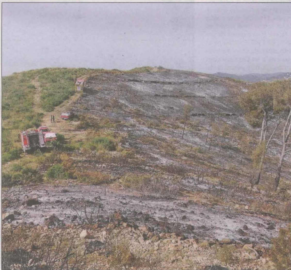
Les dotacions dels Bombers van treballar sobretot en el flanc oest de l'incendi de Baldomar

Pel que fa a l'incendi d'Artesa de Segre/Baldomar, els Bombers de la Generalitat de Catalunya continuaven treballant intensament, sobretot en les noves repeses i en el flanc oest que és el que estava més obert i amenaçava els eixos de confinament establerts. Es van mobilitzar un total de 46 dotacions terrestres i 4 mitjans aeris i segons les darreres dades facilitades pel Cos d'Agents Rurals, han cremat 2.702,67 hec-