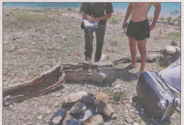
Un agent posa una sanció a un banyista a Sant Antoni