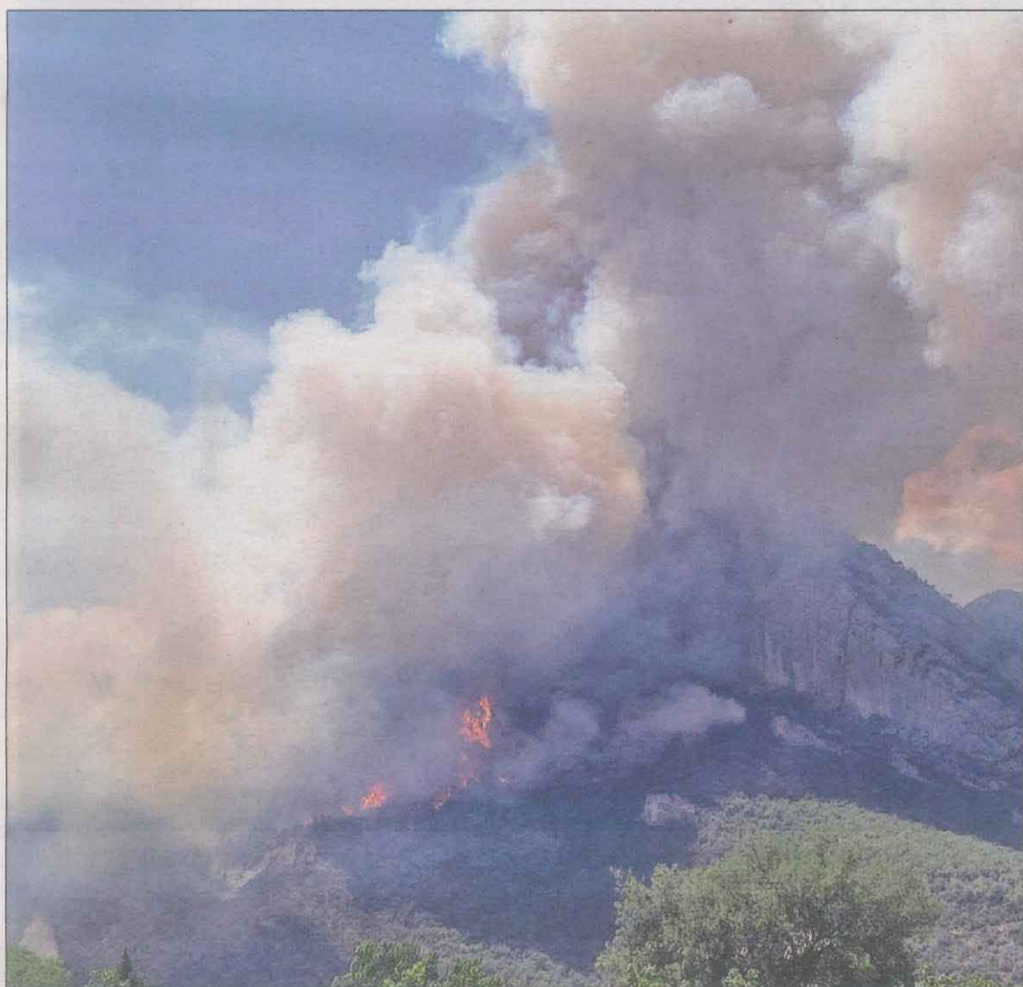
El incendio entre Peramola y Oliana comenzó ayer al mediodía y obligó a cortar la C-14