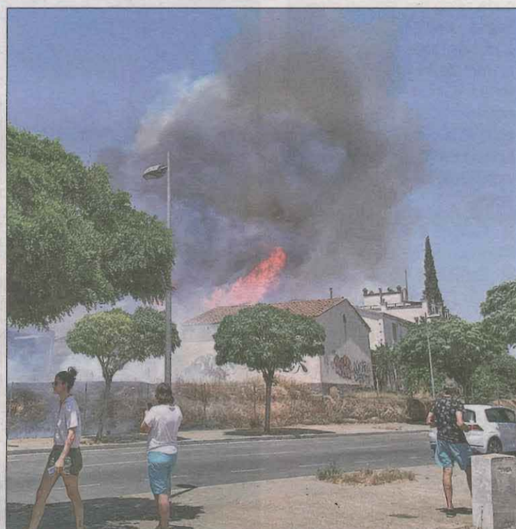
Imagen de la llamas cerca de la iglesia de Montserrat