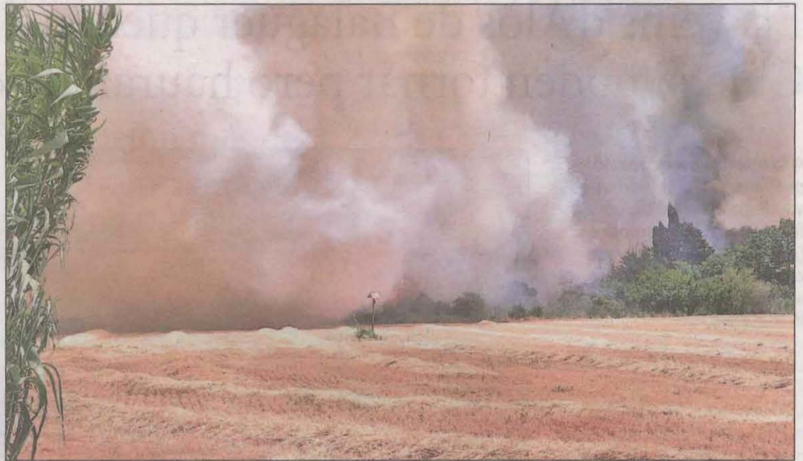
El foc va afectar les partides d'Alpicat, Fontanet lo Curt i el Camí de l'Albi

es van haver de confinar. També es van desallotjar la Llar Mare Esperança, en què hi viuen 15 nens tutelats i tres monges, el restaurant Punto Estrella i el mossèn de la parròquia de Montserrat va haver de traslladar la celebració d'una primera comunió a un altre punt. El temple no va quedar afectat perquè tot el voltant està llaurat. En el moment de tancar aquesta edició encara no es podia saber els danys materials provocats a les finques. Aquest és l'incendi més important del cap de setmana a Lleida, en què també destaquen un a l'avinguda Torre Vicens, al costat del col·legi Països Catalans, un altre al carrer Palauet a la Bordeta i un altre en un descampat davant del Grup Joan Carles de la Mariola.