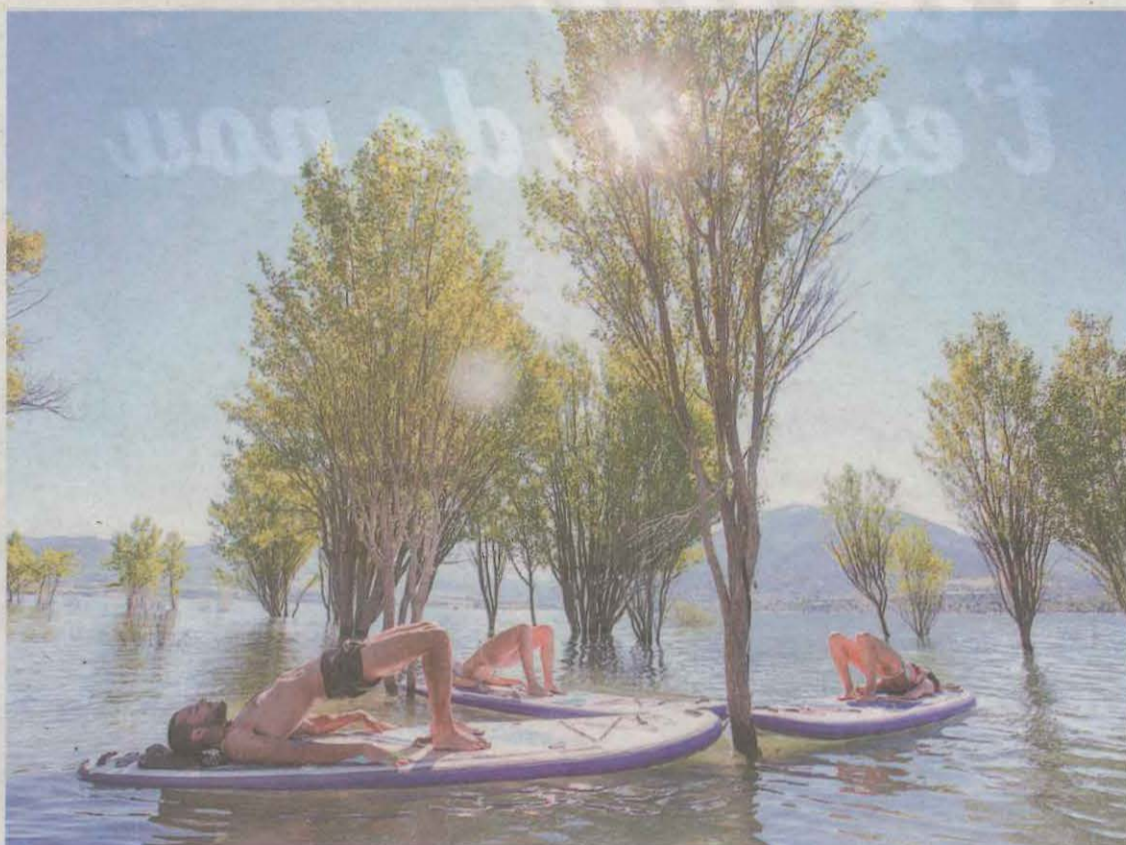
Pilates sup lake a l'embassament de Sant Antoni

El Pallars Jussà és un món per descobrir, una terra desconeguda que espera poder sorprendre amb una riquesa cultural i natural úniques, servida en petites dosis, amb l'exclusivitat d'allò que no abunda.