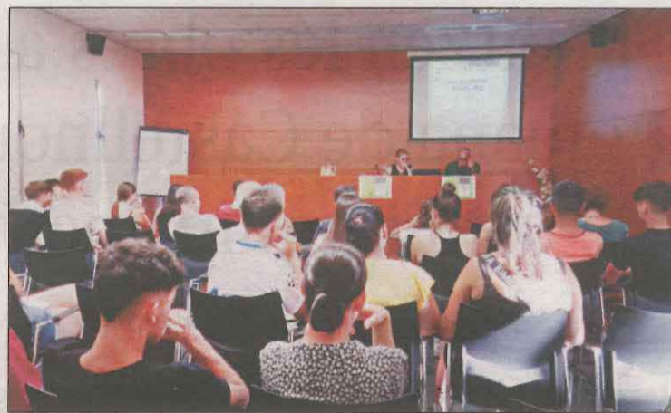
Reunió per l'incersió al món laboral

rebin una retribució que vingui a recompensar el seu esforç. Pel que fa a les tasques a realitzar, seran les pròpies de la brigada municipal, de suport en els esdeveniments que organitza l'Ajuntament i coneixent el funcionament dels diferents equipaments, fent feines de conservació i de manteniment d'espais i de l'entorn i altres labors. Quant als horaris i torns, s'ha previst oferir una ocupació de mitja jornada, amb torns quinzenals; del 4 a 17 de juliol, del 18 al 31 de juliol, de l'1 al 14 d'agost i del 16 al 3 de setembre.