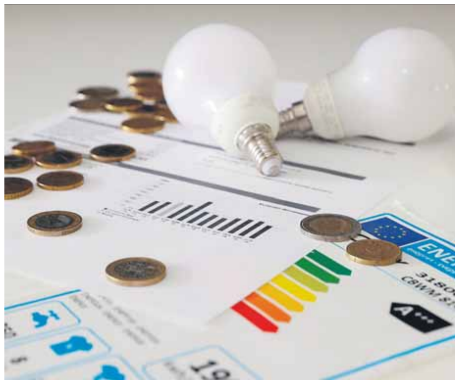
El rebut de la llum no s'encarirà més pel gas almenys fins al maig del 2023

Durant els primers sis mesos, el límit al preu del gas en el mercat majorista ( pool ) es fixarà en 40 euros per megawatt hora (MWh), i després anirà pujant 5 euros cada mes, de tal manera que en l'últim mes d'aplicació serà de 70 euros per MWh. La mitjana de tot el període serà de 48,8 euros per MWh. Sánchez, que espera avui al Congrés que ERC i la resta votin aquest pla per abaratir la llum, veu com la presidenta de la Comissió Europea, Ursula von der Leyen, fa seu el qüestionament de "l'estructura del mercat elèctric". ■