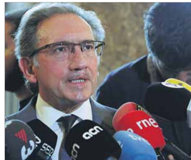
El conseller d'Economia i Hisenda, Jaume Giró, ahir en una sessió informativa al Parlament

Giró va demanar que la Generalitat pugui fer un dèficit de l'1% en aquest exercici per fer front a la despesa social i sanitària. D'altra banda, va recordar que Catalunya té el seu model de finançament "caducat" des del 2014 i el govern no sap quins recursos rebrà de l'Estat. ■