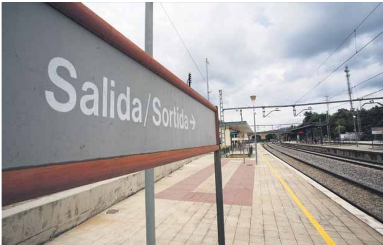
Andana a Sant Sadurn d'Anoia. La inversió en la xarxa ferroviària i el corredor mediterrani és testimonial ■ ORIOL DURAN