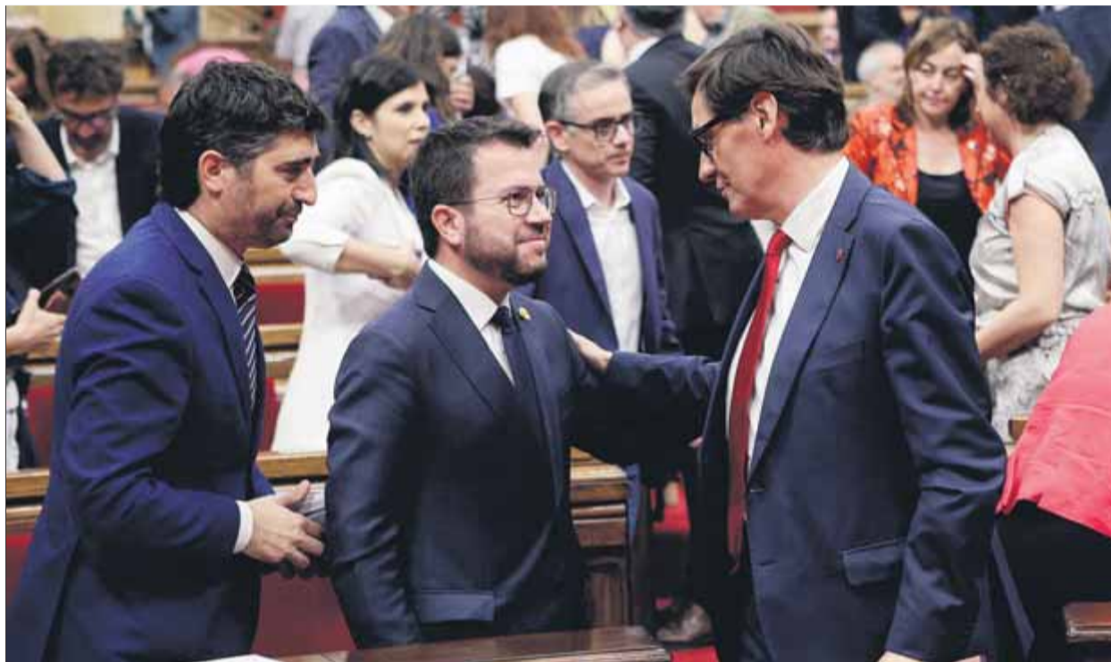
Aragonès, Puigneró i Illa, ahir després de l'aprovació en lectura única de la llei sobre el català i el castellà a l'escola

A primera hora del matí el PSC, ERC, Junts i En Comú Podem aprovaven finalment la proposició de llei sobre els usos del castellà i el català en l'ensenyament no universitari en resposta a les sentències judicials que obliguen a impartir un 25% de castellà als centres en què així ho demanin els pares dels alumnes. L'ús de la llengua catalana en l'ensenyament ha esdevingut font