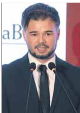
Rufián, diputat d’ERC

“No només no hi estic d’acord, sinó que en discrepo absolutament”, deia el president, Pere Aragonès, que exigia una rectificació de Rufián, que no tardaria a arribar: “Demano disculpes a qui s’hagi sentit ofès, començant pel president Puigdemont, el president Aragonès i el vicepresident Junqueras. Crec que es podia explicar