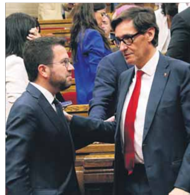
El president de la Generalitat, Pere Aragonès, i el cap de l'oposició, Salvador Illa, ahir al Parlament

■ Puigneró fa seva la frase "Espanya ens roba" per descriure dèficits en infraestructures i accessos viaris