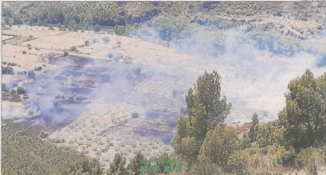
El foc va calcinar 9,3 hectàrees de camps i arbratge.

Paral·lelament, una desena de dotacions van seguir actives durant la matinada d'ahir a Juncosa per evitar que el foc forestal